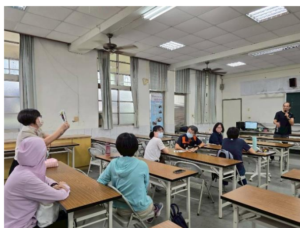
相片說明：參與研習教師分享