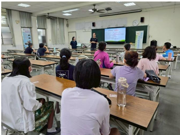
相片說明：人權活動體驗講解