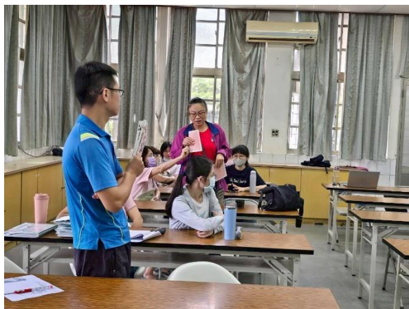
相片說明：參與研習教師分享