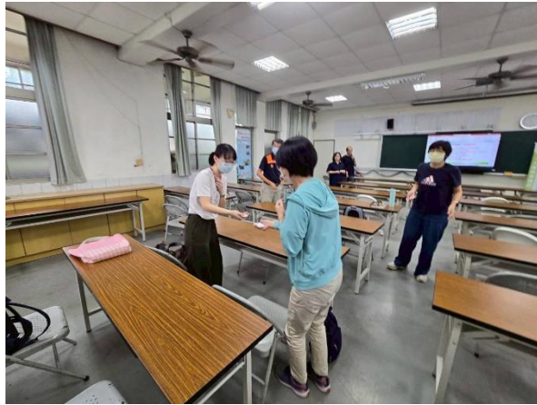
相片說明：人權活動體驗