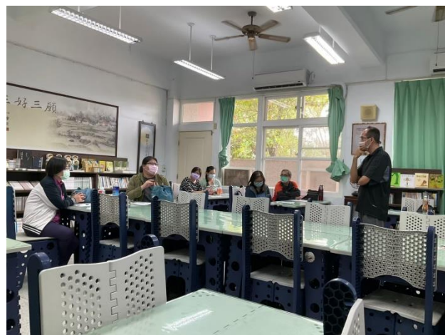
相片說明：參與學員發表