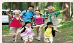
折衷家庭是由祖父母、父母與未婚子女所組成的家庭。