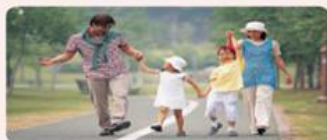
小家庭是由夫婦倆人與其未婚子女所組成的家庭，又稱為核心家庭。