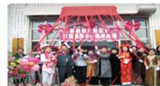
政府設立新住民關懷據點，協助新住民適應環境及生活。