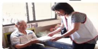
志工送餐給獨居老人。