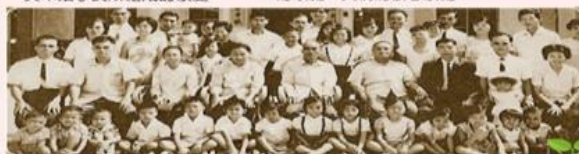
大家庭的家庭成員，包括夫妻及其有血緣關係的一大群親族。