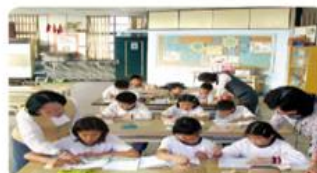
政府及民間團體透過課後輔導、提供獎助學金等方法，協助弱勢兒童。

家庭型態改變所帶來的變遷，例如：少子化、子女教養、獨居老人等現象，值得社會多加關注。