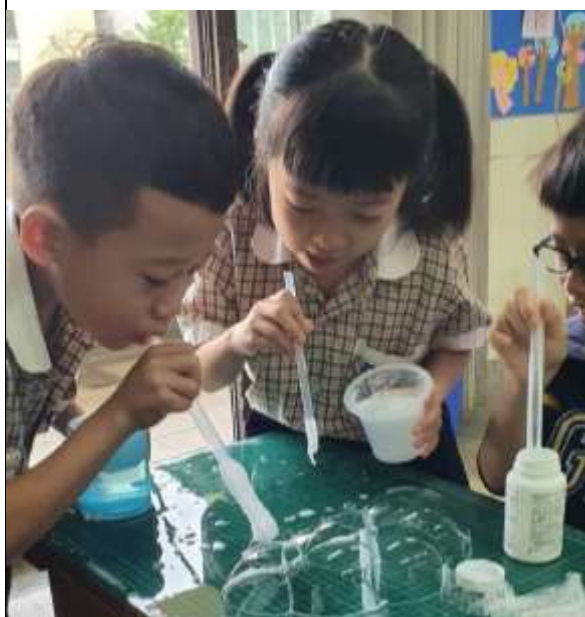
創意做泡泡並命名：泡泡毛毛蟲