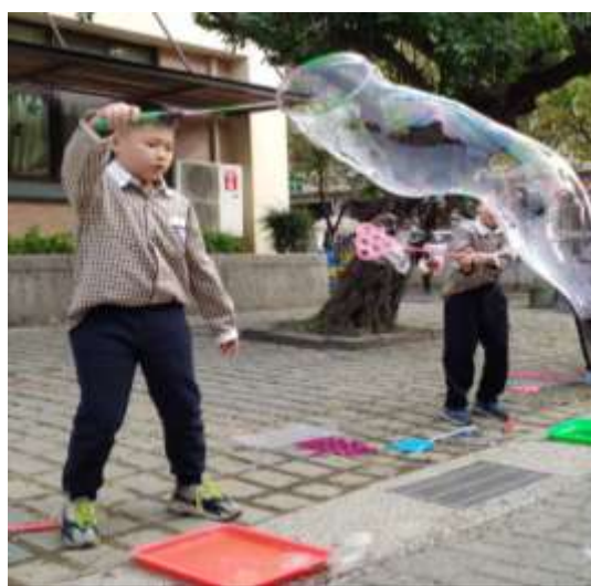
使用生活中的物品做出泡泡(羽球拍)