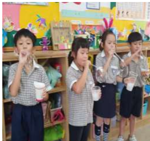
小組分享成功經驗