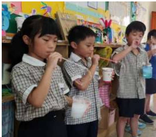
小組分享成功經驗