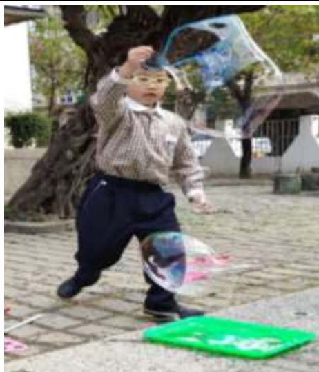
使用生活中的物品做出泡泡(鐵絲網)