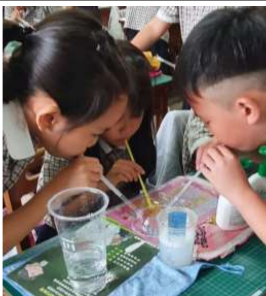
運用不同方法吹出創意泡泡