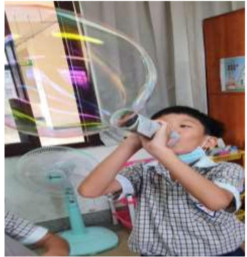
創意做泡泡並命名：七彩魔法泡泡