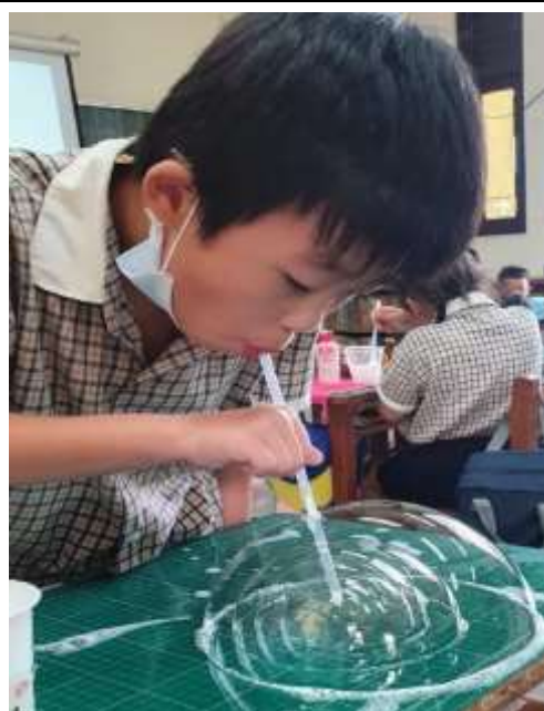
創意做泡泡並命名：泡泡漩渦