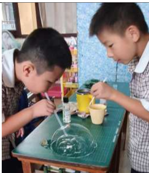
運用不同方法吹出創意泡泡