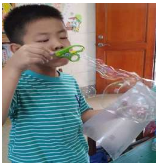
使用剪刀握把吹出泡泡