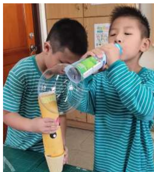
使用墊板吹出泡泡