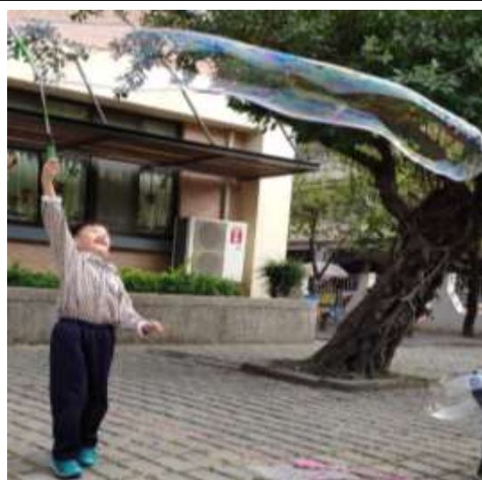
室外觀察泡泡的外形和特徵