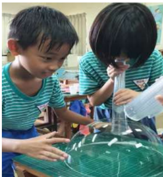
觀察泡泡的外形和特徵