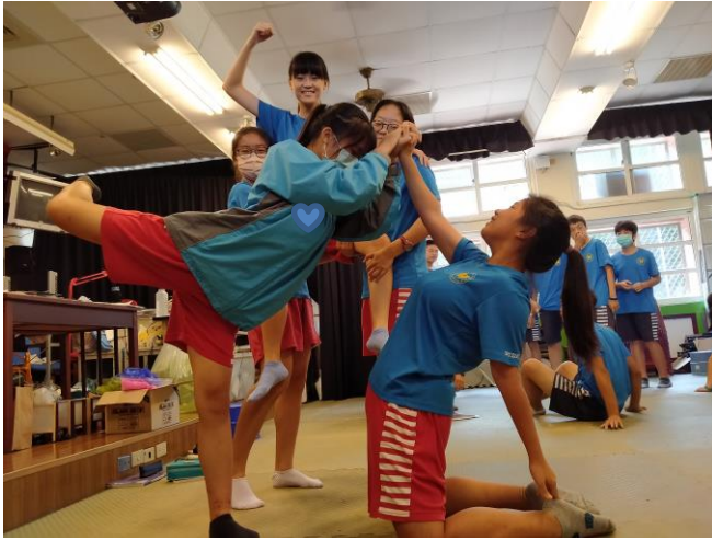
靜像劇場-新住民表演藝術再創作（東南亞民俗舞）