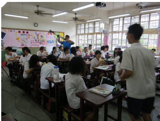
教習劇場-「愛無界」·響排與團體即興