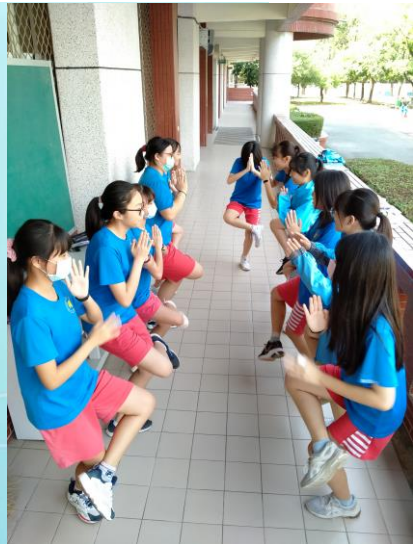
靜像劇場-新住民表演藝術再創作（泰國佛舞）