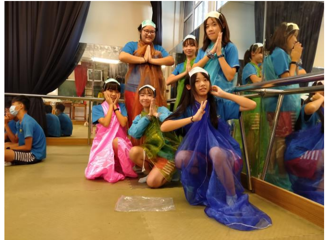
靜像劇場-新住民表演藝術再創作（泰國佛舞）