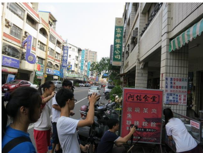
教習劇場-「愛無界」·微電影實作