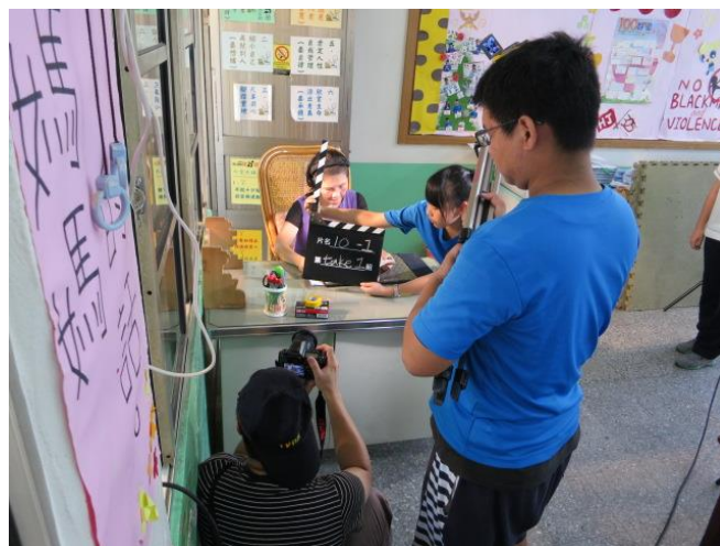
教習劇場-「愛無界」·微電影實作