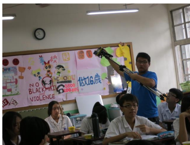
教習劇場-「愛無界」·響排:發展對白