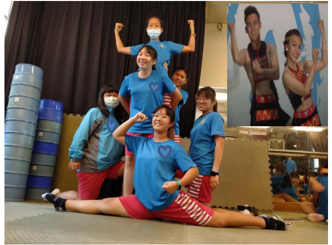
靜像劇場-新住民表演藝術再創作（東南亞民俗舞）

目前的台灣社會的確存在著偏見這個問題，有些人會因為自己是外籍配偶的子女而感到自卑，嚴重甚至埋怨自己的父親... 在我們可以伸出援手的情況下盡到自己最大努力，就算不行也也要做到「不帶著有色眼鏡看待」。在接觸到的新住民中也確實有不太令人喜歡的，但不能輕易的以偏概全！抱著同理心的懷著自己也不喜歡被這樣對待，現在的新住民間就像是以前的原住民，是需要政府和大眾的期許才能達到一個共同友善的社會環境。 ② Before 我是一個常以火車來往外縣與台南的人，在火車上多多少少會遇到一些外籍移民，最常見的大概就是他們帶著手捧聖經，聲音大到整個車廂都聽得到，因此我其實有點排斥坐在他們附近。 After 在這次的表演課跟觀後，對於外籍移民的想法或多或少的產生一些改變，因為這項活動也去網路查了很多人對外籍移民這件事情的想法，在看了那麼多想法和這次的活動，更多的是理解和理解。