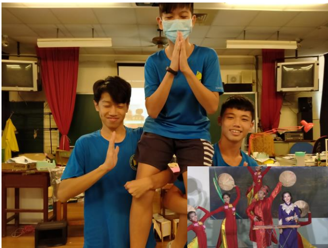
靜像劇場-新住民表演藝術再創作（泰國佛舞合 併越南民俗舞）