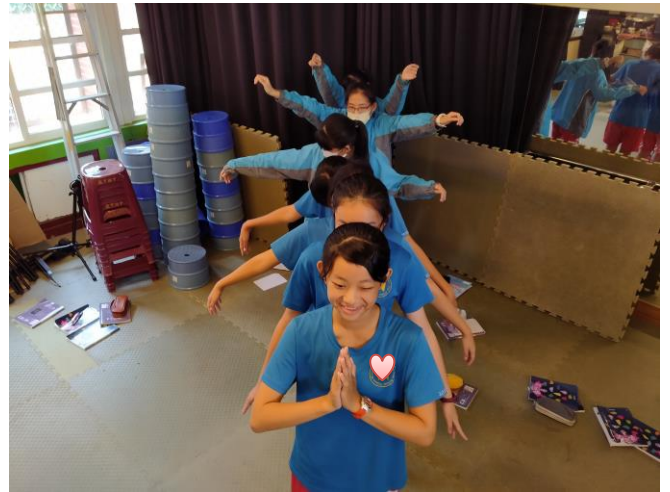
靜像劇場-新住民表演藝術再創作（泰國佛舞）