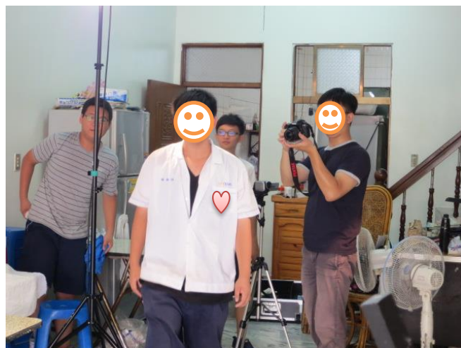
教習劇場-「愛無界」·微電影實作