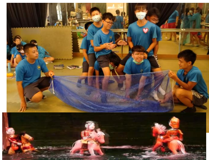
靜像劇場-新住民表演藝術再創作（水上傀儡）