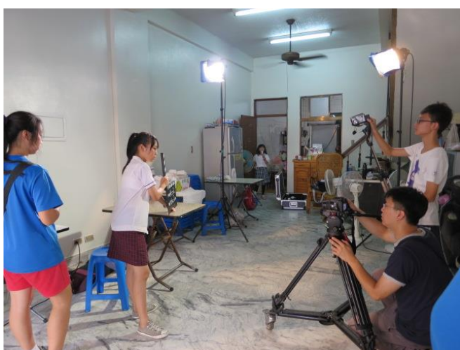
教習劇場-「愛無界」·微電影實作