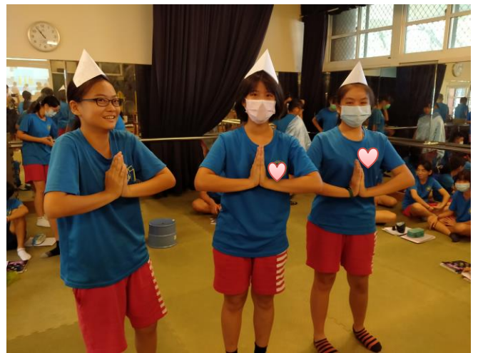
靜像劇場-新住民表演藝術再創作（泰國佛舞）