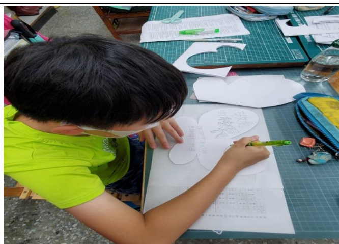
也練習了對稱的美感