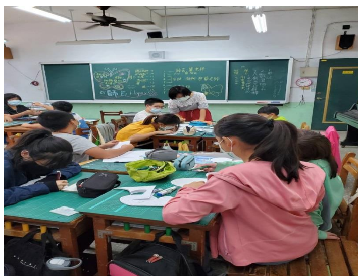
老師說明蝴蝶卡的製作