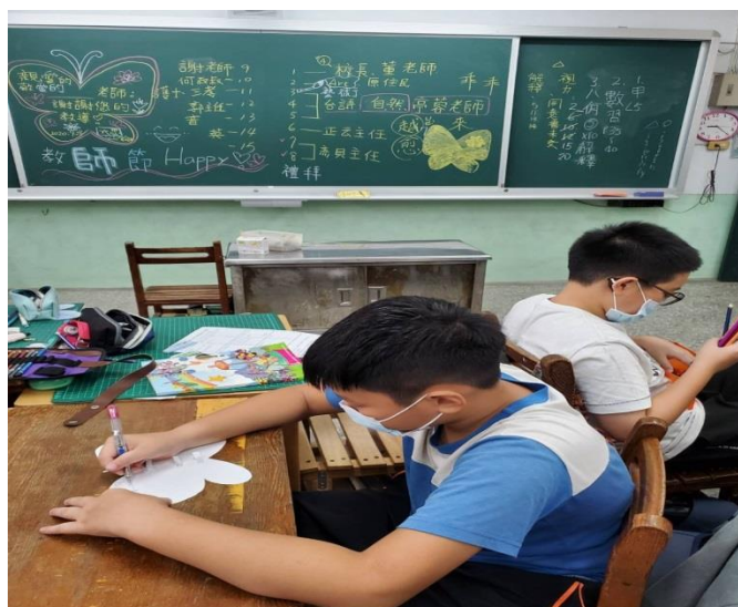
一邊憶念師長的付出，一邊用心書寫文句