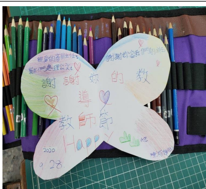
利用節日氛圍，觀察平日的付出