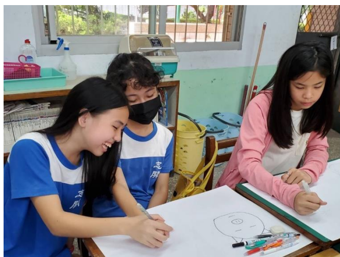
不一樣的體驗活動讓彼此關係更和諧了