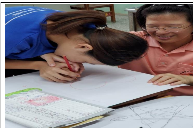
老師和落單的同學一起進行體驗活動