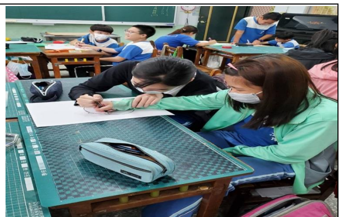
每一組同學專注的進行體驗活動