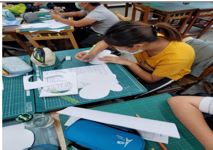
雖然是特殊生，但也在此教學活動中愈發肯定自我