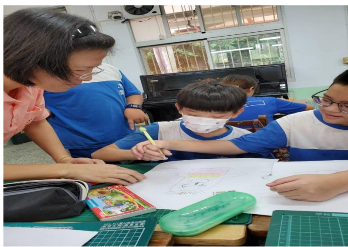
有的人擔心破壞原先的畫作而裹足不前