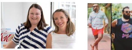
第 3 組