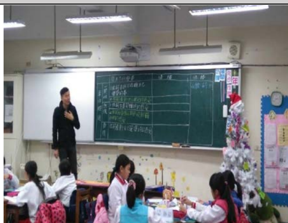
依莉的心情臉譜表格提問