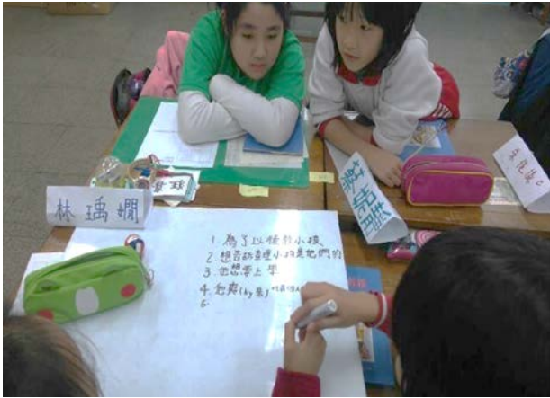
學生進行組內討論