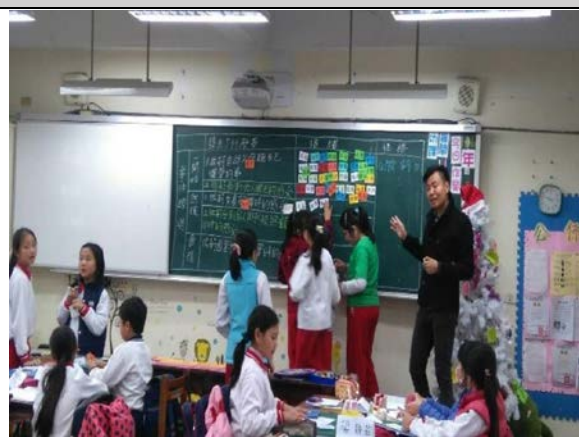
孩子上台貼情緒卡