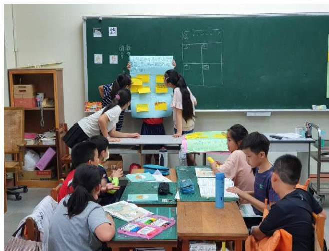
說明：桌長報告海報上各組討論的結果