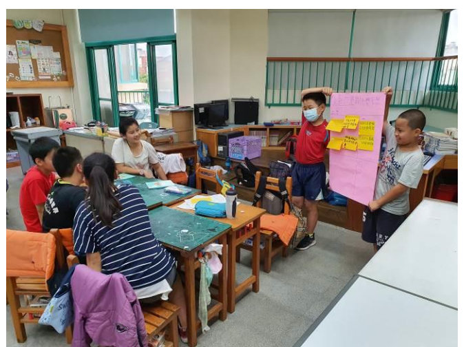
說明：進行世界咖啡館模式小組討論