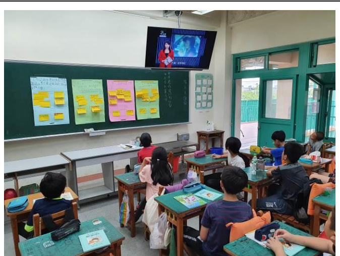
說明：觀賞葉永鋳事件報導