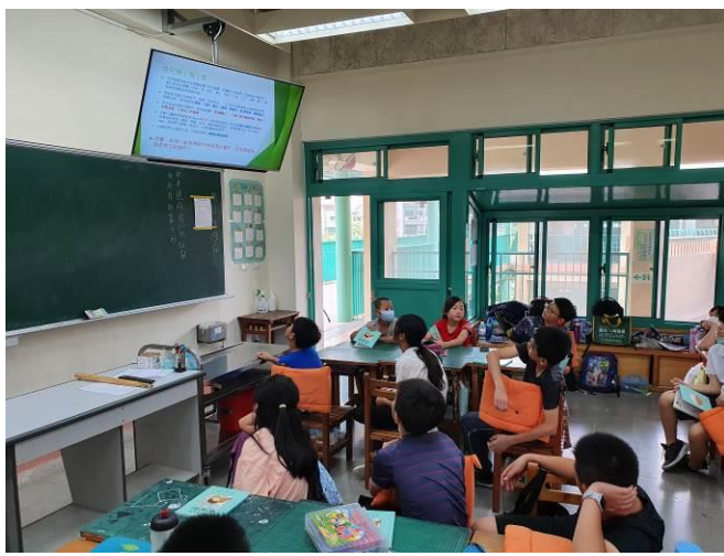
說明：利用簡報建立多元性別概念