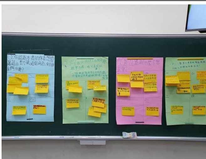
說明：各組討論海報