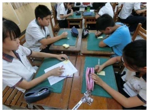
各組先個別將想法寫在便利貼， 再貼在組別學習單討論後發表。