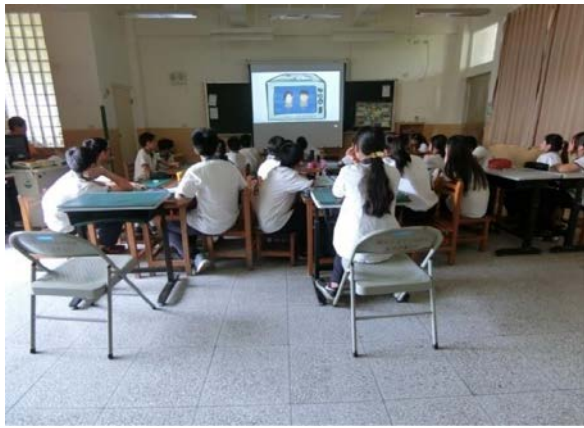
觀看木擊者--- 什麼是歧視?什麼是歧視性言論?