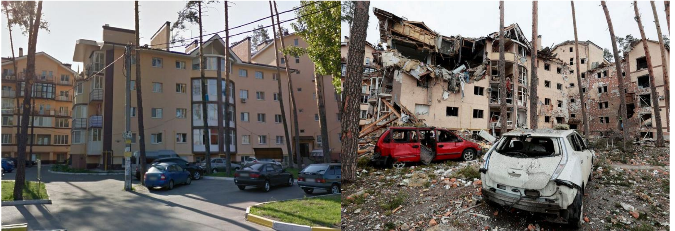
伊爾平 的民房住宅在戰爭前的完好模樣。google