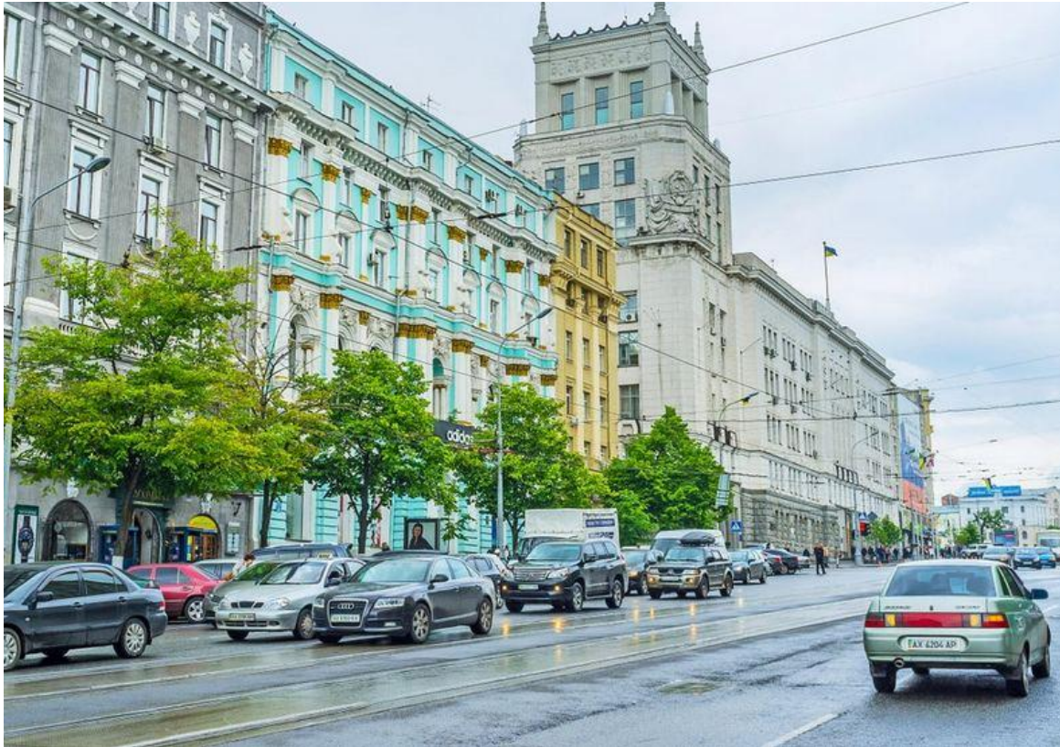
哈爾科夫憲法廣場戰爭前。google