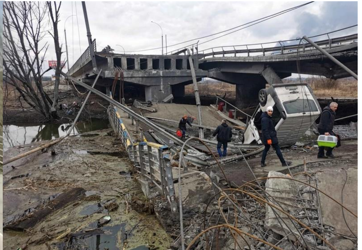
戰爭後的 伊爾平橋 。