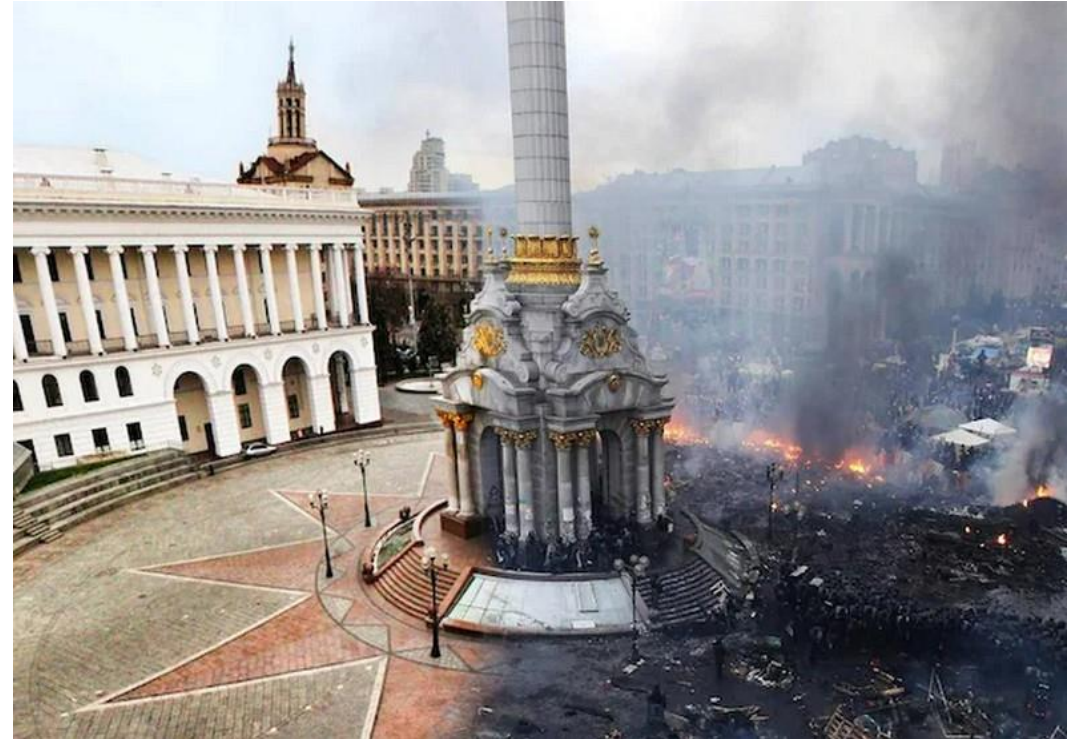
基輔獨立廣場 前後照片的對照合成圖。indiatoday