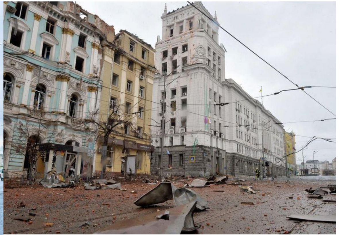
哈爾科夫憲法廣場戰爭後。