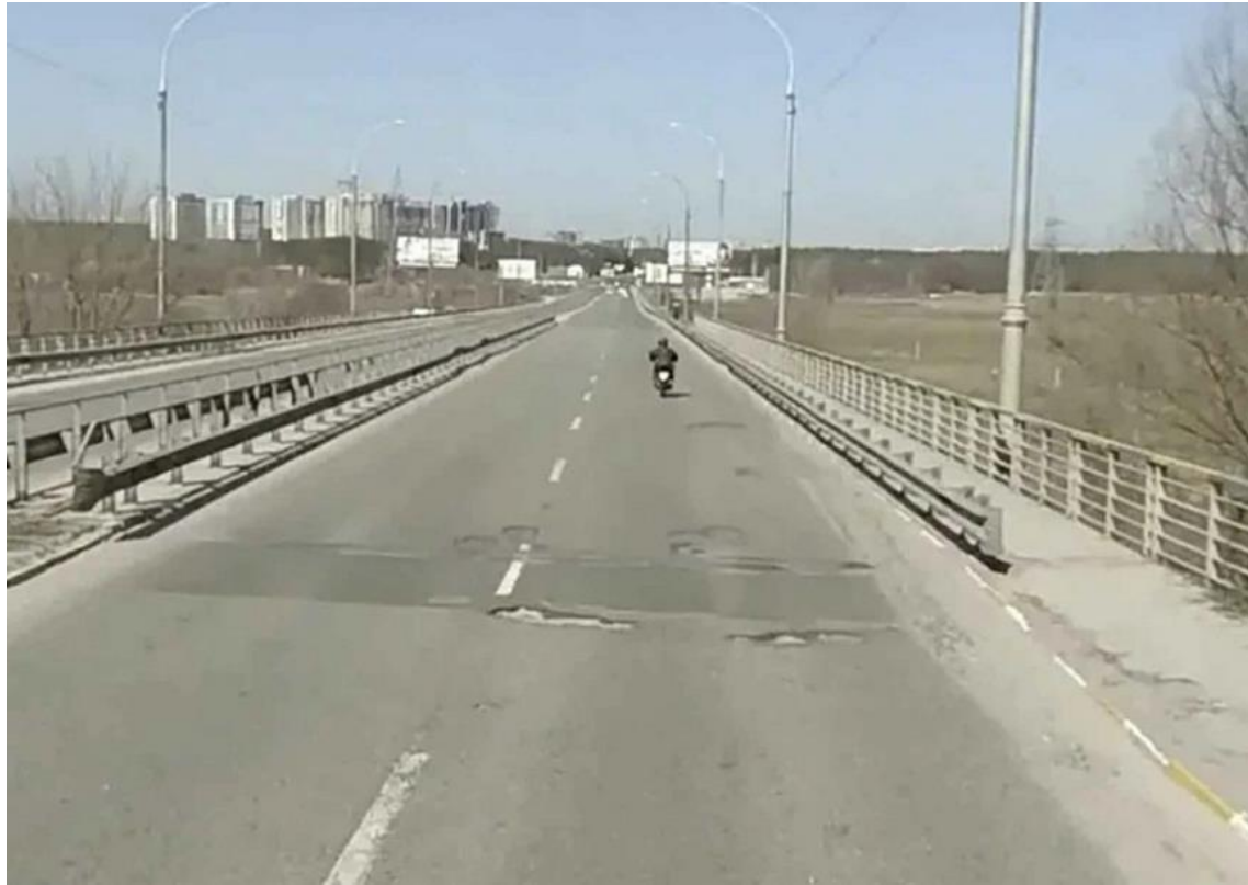
戰爭前的 伊爾平橋 。google