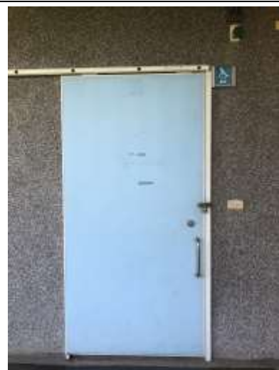
身心障礙專用廁所