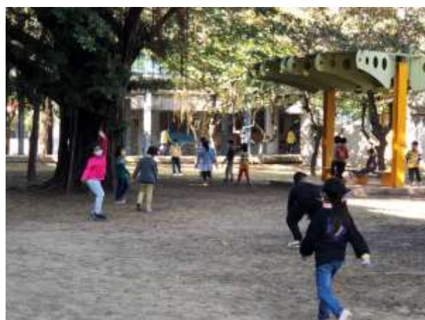
低年級遊戲區(拍攝期間遊樂器材維修中)