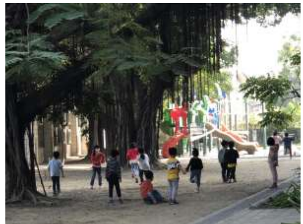
低年級遊戲區-2(拍攝期間遊樂器材維修中)