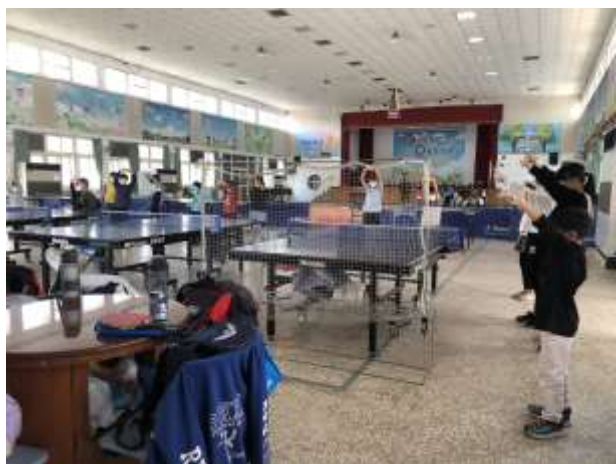
活動中心(桌球隊/直排輪社團)-1