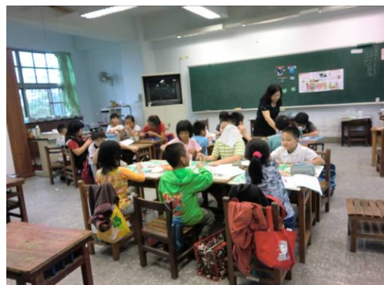
江老師指導藍衫的做法