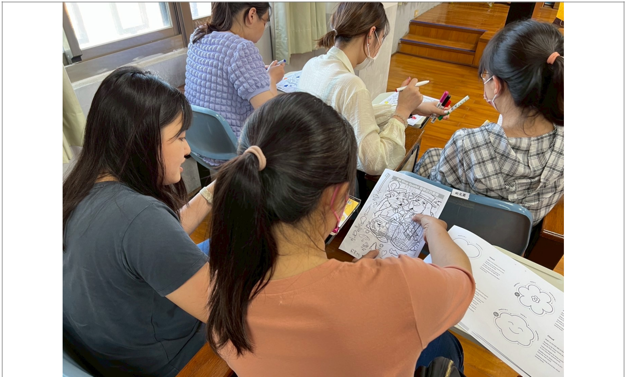
照片說明： Hidden pictures 合作遊戲