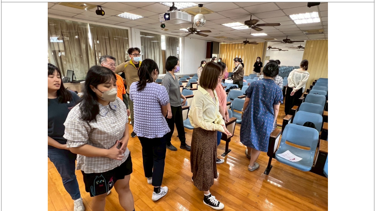
照片說明： Canon演唱體驗