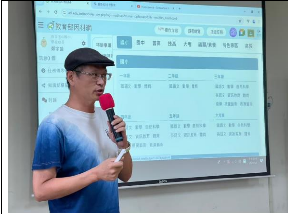
教育部因材網內容簡介與操作