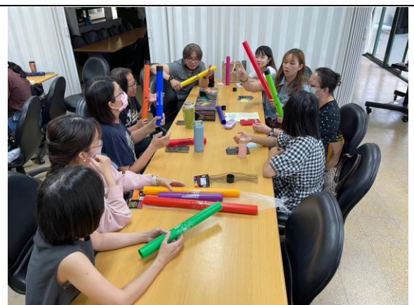
2.律音管高低音域轉換演奏討論