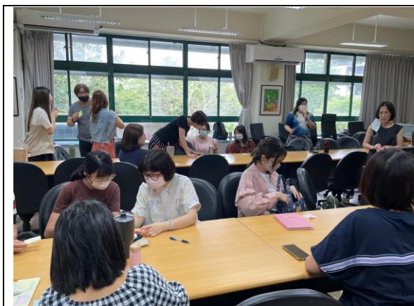
1.找尋有相同季節感覺的夥伴