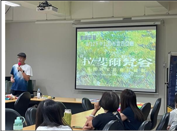
20240812 奇美博物館教師研習