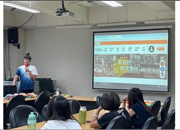
教育的時空旅行主題展