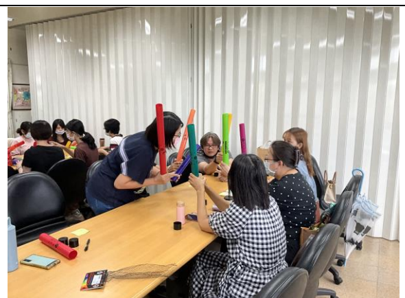
4.故事配音員作品分享