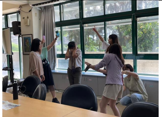
說明:運用靜像畫面技巧，即興呈現可能發生的事情