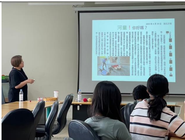
說明:透過 PPT 介紹學生的成果