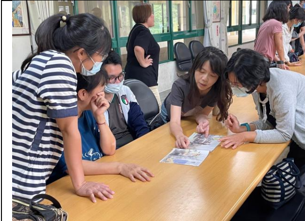
說明:分組觀察瘋狂星期二繪本圖片並討論 6W