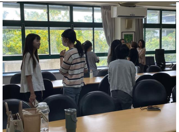
說明:設定角色，告訴其他人發生什麼事情(閒言閒語)