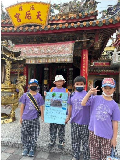
學生進行實地導覽