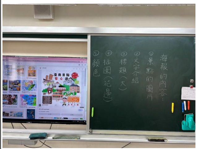
讓學生觀看海報範本，整理做海報重點