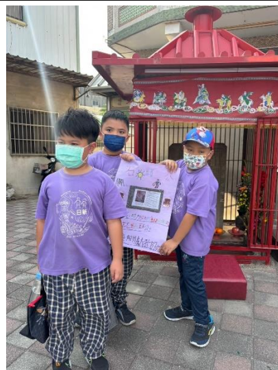
學生進行實地導覽