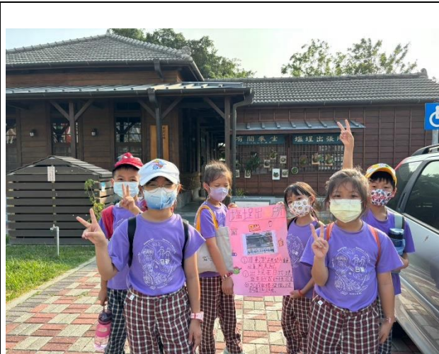
學生進行實地導覽