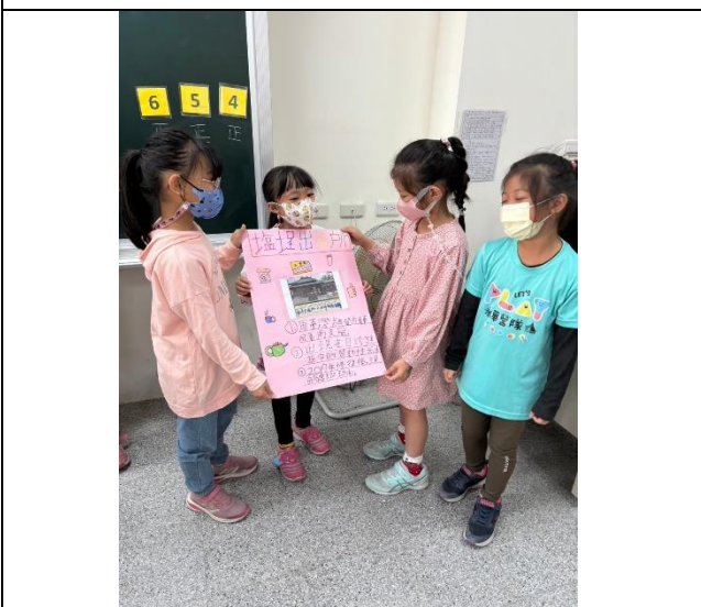
學生示範組上台演練如何介紹