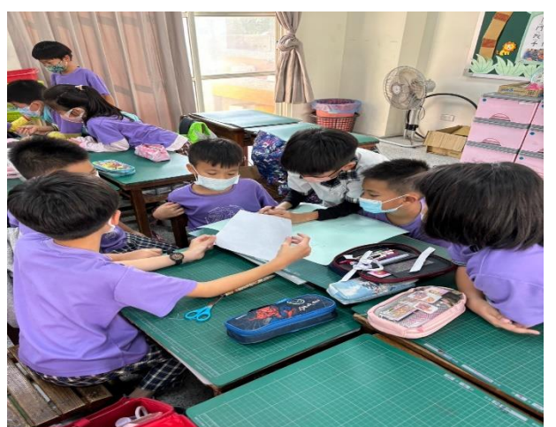
學生開始製作海報