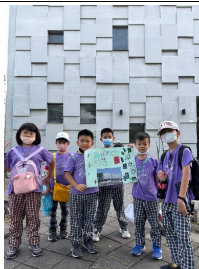
學生進行實地導覽