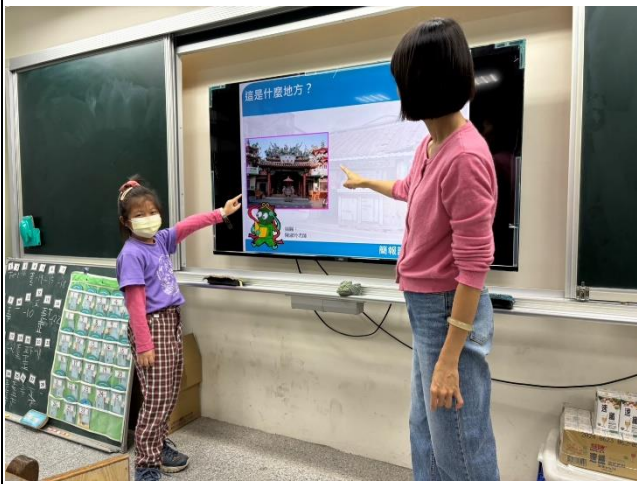
透過圖片請學生說出這是學校附近哪個地方