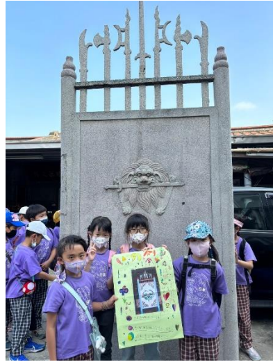
學生進行實地導覽