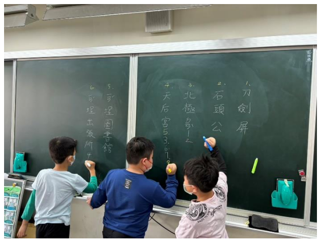
整理學生答案，並請學生選擇、分組