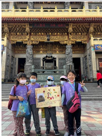
學生進行實地導覽