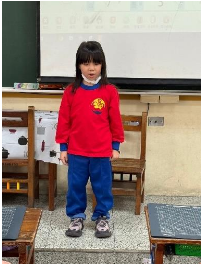
學生試著說話但不發出聲音，讓其他同學讀唇猜猜看說了什麼。