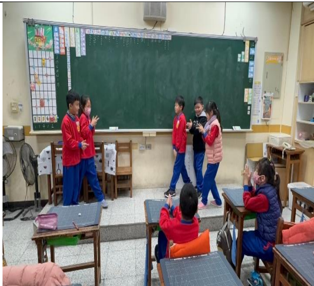
學生情境劇的演出，表演場景是在緝捕犯人。