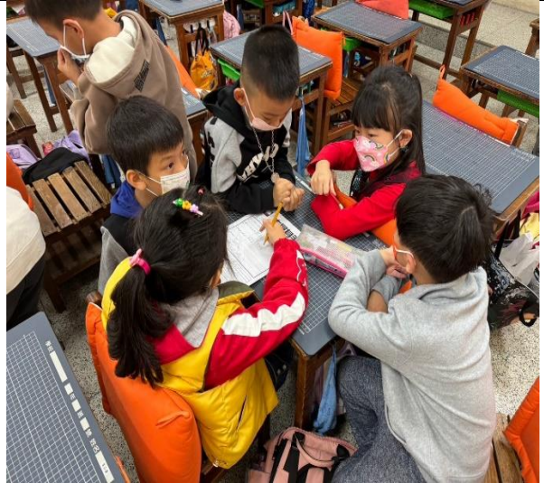
小組討論完成「大展身手」學習單。