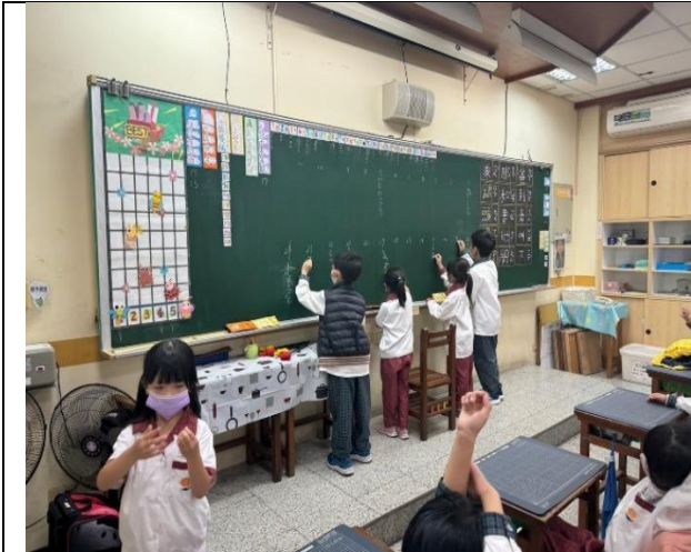
學生上臺書寫日常生活中曾經聽到過的聲音。