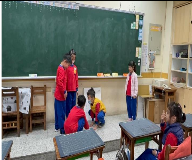
學生情境劇的演出，表演場景是在公園。