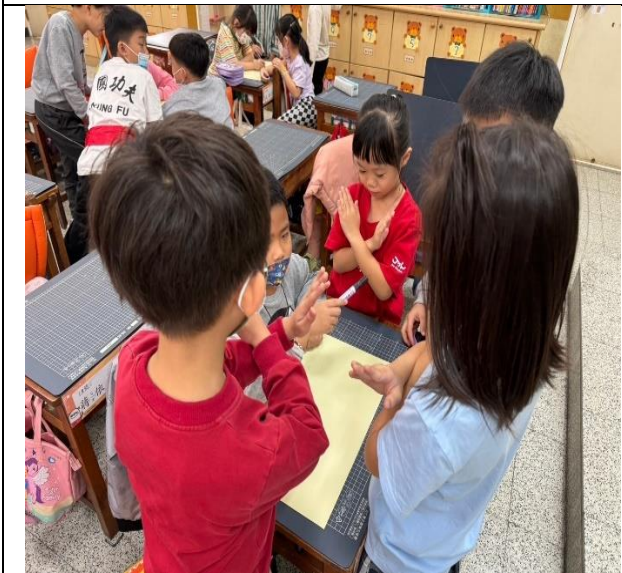
小組同學分類黑板上的聲音，哪些事喜歡的，哪些是不喜歡的。