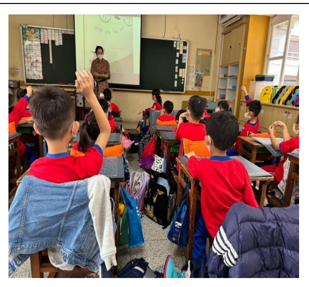
老師讓孩子們猜測繪本中所提到的聲音是從哪裡發出來的。