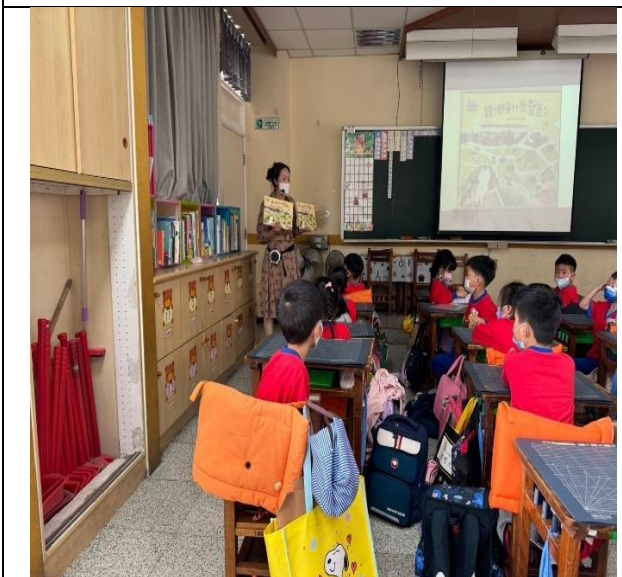
老師導讀繪本-《聽！那是什麼聲音？》