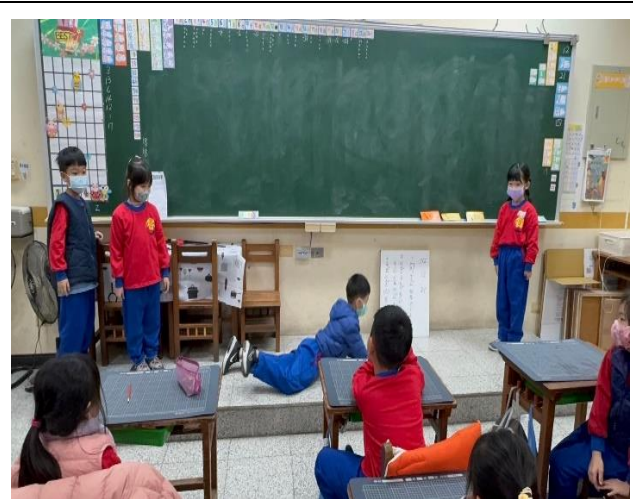
學生情境劇的演出，表演場景是在沙灘。