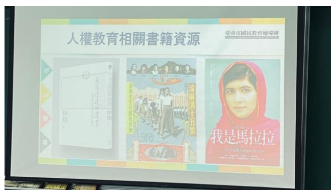
相片說明：人權教育相關書籍資源分享