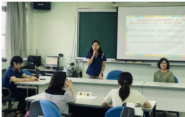
相片說明：領隊校長開場介紹