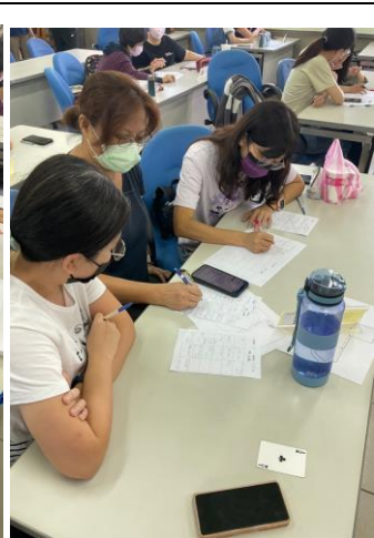
相片說明：小組討論