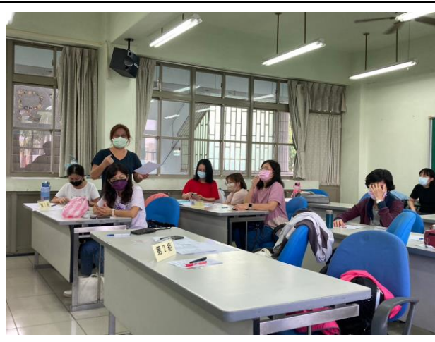
相片說明：學員分享