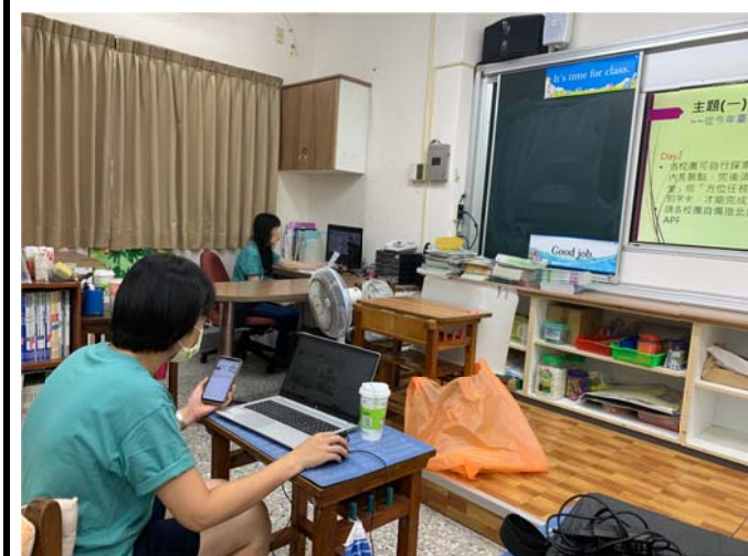
說明：亮點教師分享「校園建築意象探索」課程