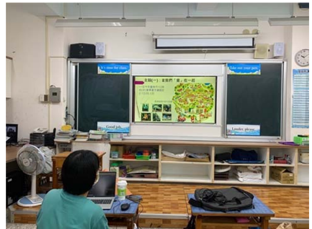
說明：亮點教師分享「校園建築意象探索」課程 展現教學成果，呈現教育的各種樣貌