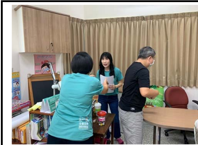
說明：麗玲老師與團員夥伴協力籌備說課