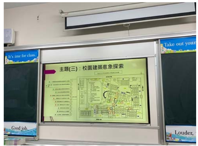
說明：亮點老師分享「校園建築意象探索」課程