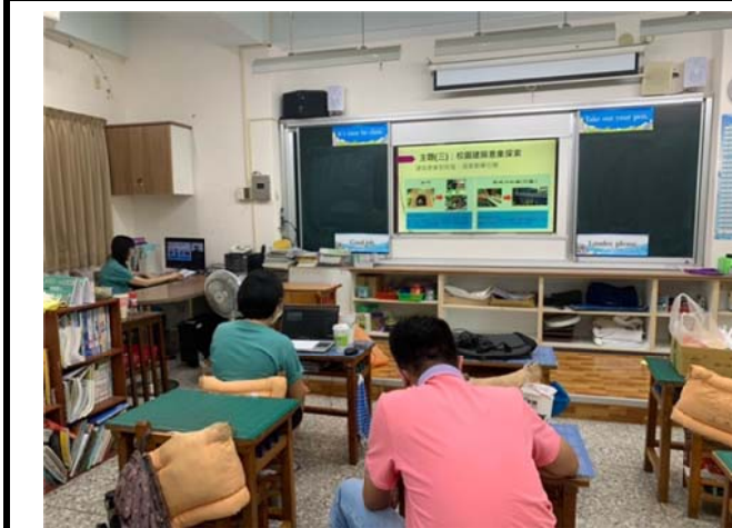
說明：亮點教師分享「校園建築意象探索」課程