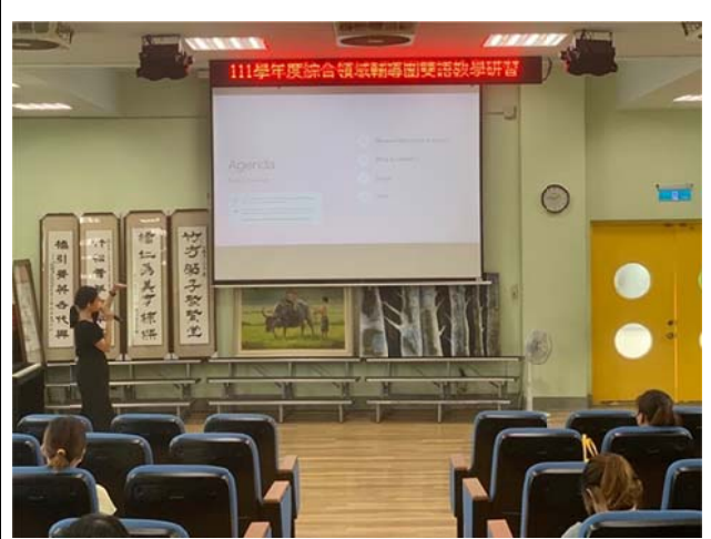
說明：授課講師分享雙語教學課程設計示例