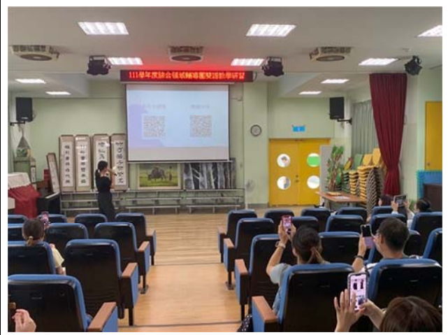
說明：雙語教學活動示例資源說明與下載點