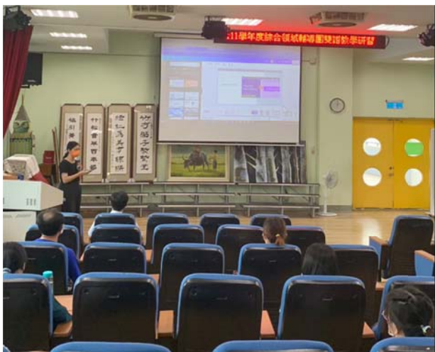
說明：提供與會夥伴相關資源及回饋機制