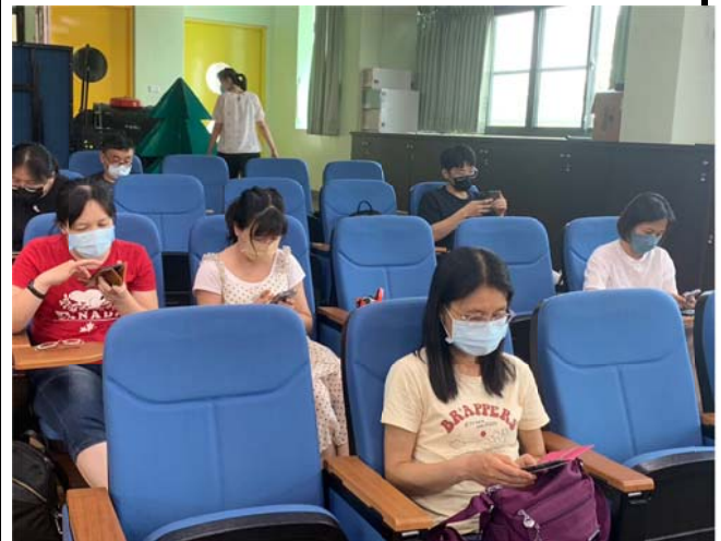
說明：提供與會夥伴相關資源及回饋機制