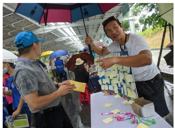
說明：教育局股長共同參與活動