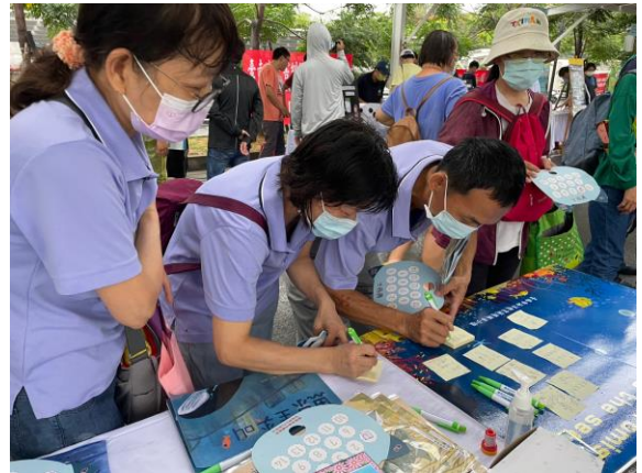
說明：民眾熱情參與本攤位與海洋有約活動。