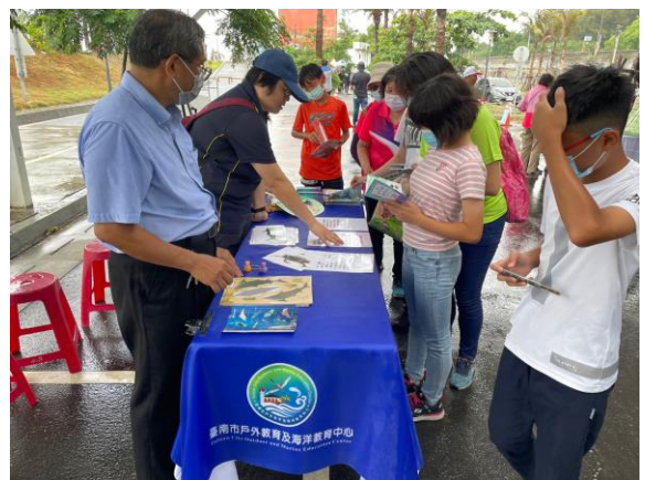
說明：戶海中心同樣展出海洋議題攤位