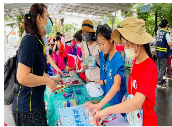
說明：攤位提供闖關與體驗