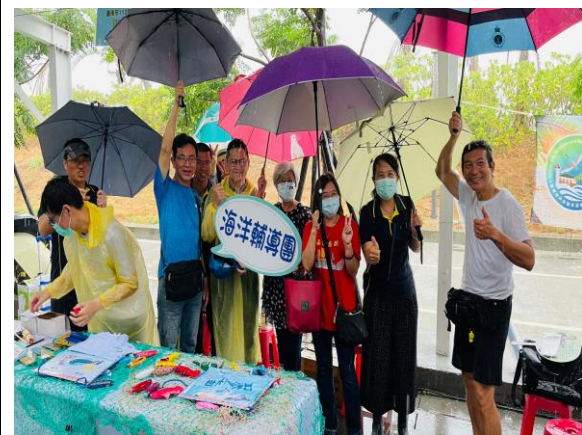
說明：眾團員遇雨仍士氣高昂