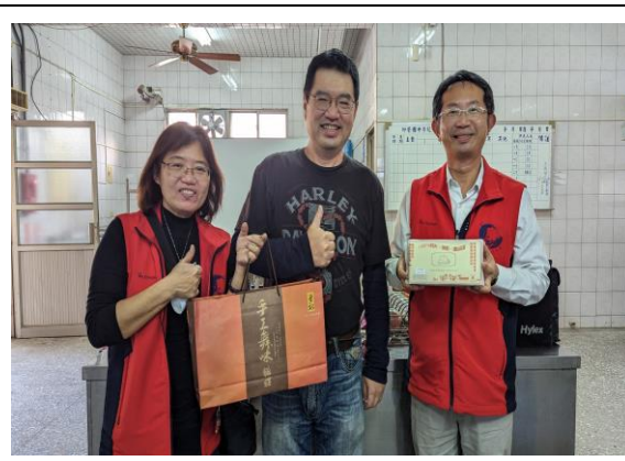
說明：致贈感謝狀與伴手禮