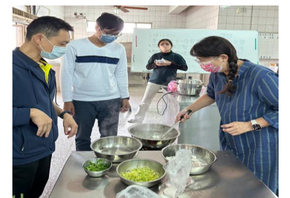
說明：學員認真製作虱目魚料理中