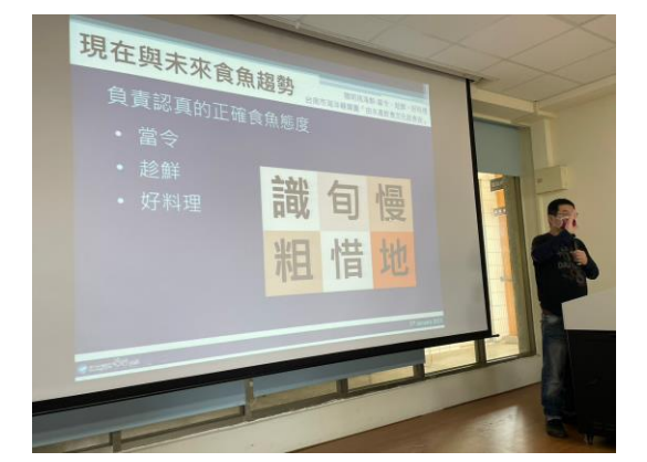
說明：介紹現在與未來食魚趨勢，培養食安與永續資源利用觀念