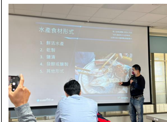
說明：由食魚文化→養殖，進一步論述到應用於生活中的水產食材挑選方式