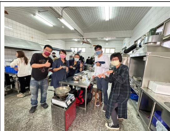
說明：參與教師齊心合力，與親手製作的料理合照