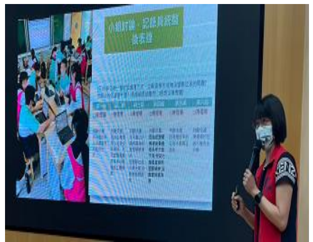
說明：小組討論示範