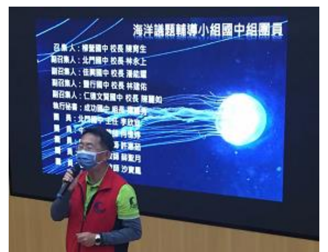
說明：海洋團成員介紹