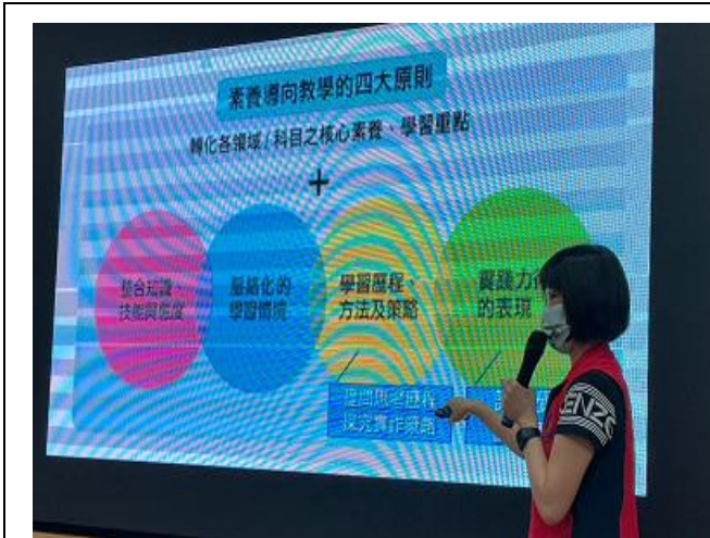
說明：素養導向原則說明