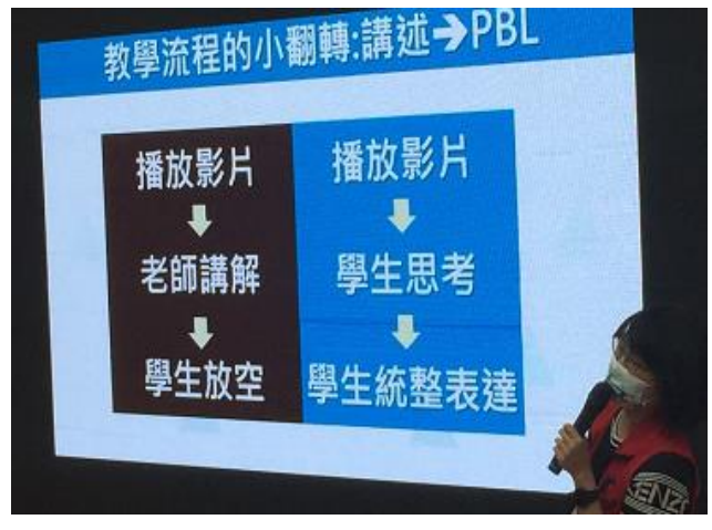
說明：PBL 教學流程分享