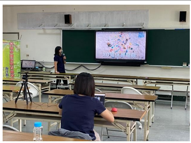
說明：以創意影片介紹海洋污染的現況。