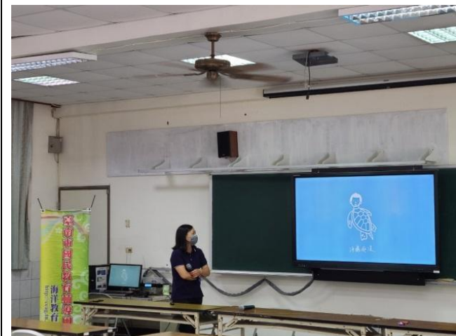
說明：海洋相關教材介紹— youtuber「海龜痴漢」的海洋 環境紀錄