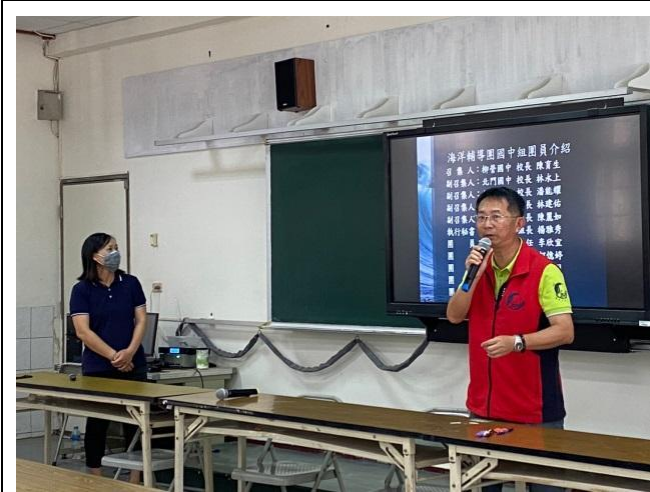
說明：開場，世界海洋日活動宣導