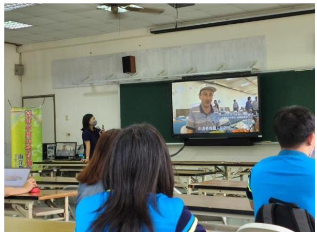
說明：科學海產養殖試吃評比活動。