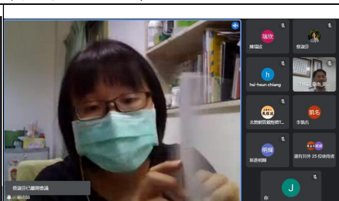
相片說明：講師對學員介紹本次研習的課程內容