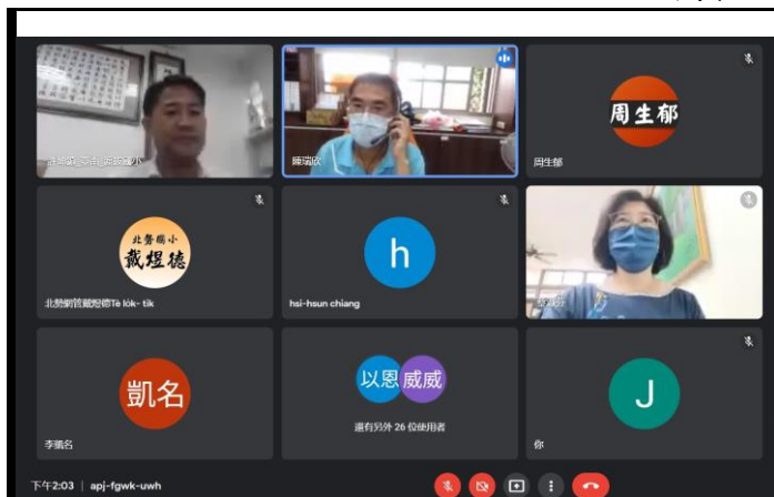
相片說明：許校長對於與會教師進行科技領域領課綱宣導