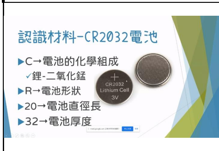
相片說明：講師介紹實作電路紙卡片所需材料