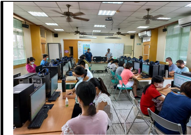
相片說明：陳校長對於與會教師進行科技領域領課綱宣導