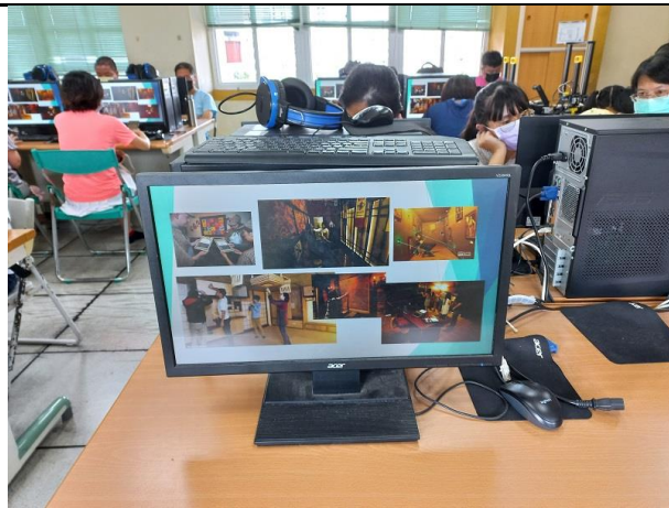
相片說明：學員進行密室逃脫課程研習