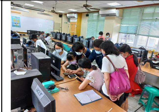
相片說明：學員進行密室逃脫課程研習