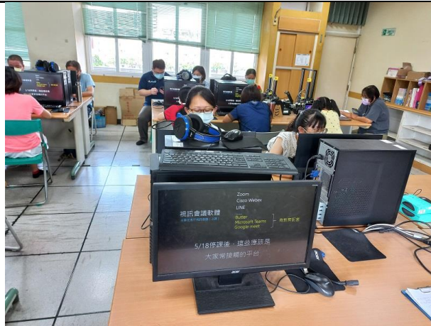
相片說明：輔導團員介紹線上教學常用軟體