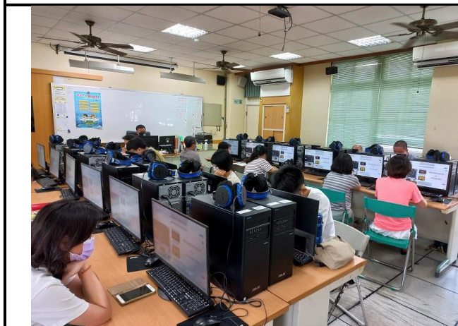
相片說明：輔導團員介紹線上教學常用軟體