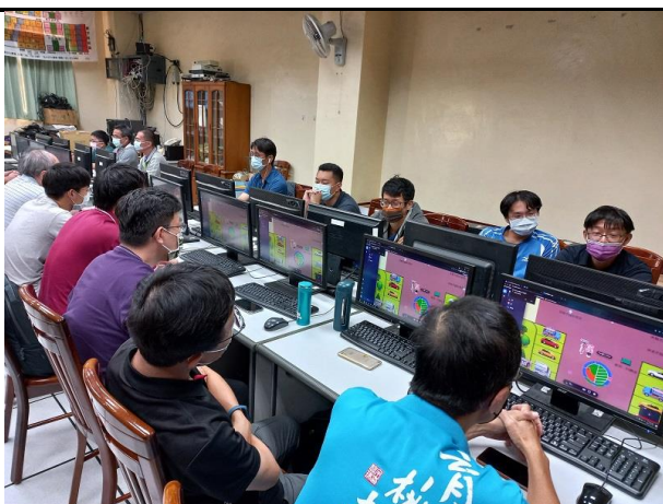
相片說明：輔導團員介紹線上教學常用軟體