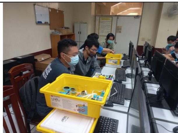
相片說明：學員進行SPIKE機器人組裝