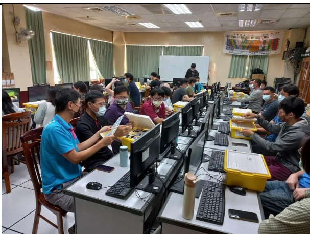
相片說明：林老師帶領學員進行SPIKE機器人組裝