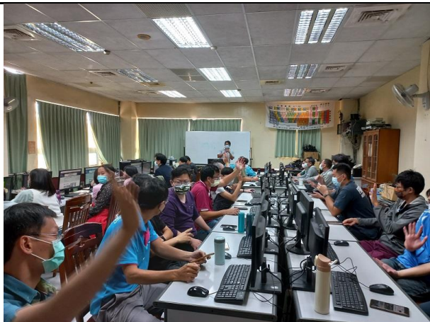
相片說明：陳校長對於與會教師進行科技領域領課綱宣導