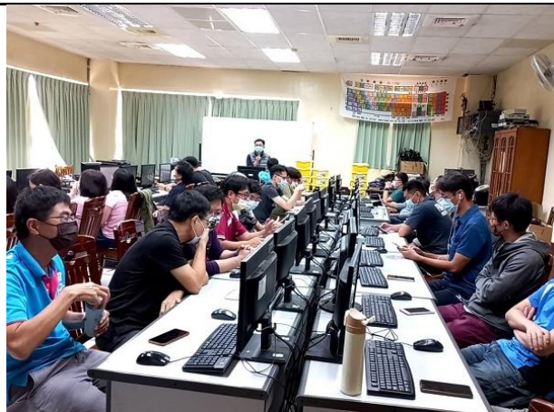
相片說明：李校長對於與會教師進行科技領域領課綱宣導