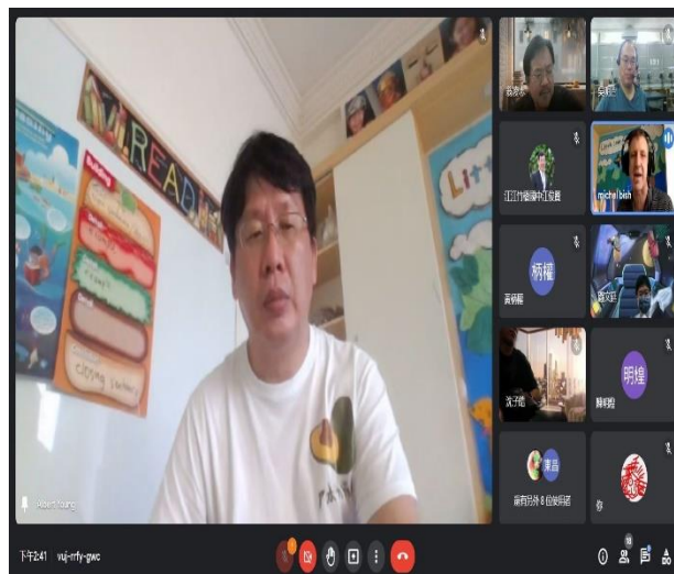
相片說明：線上研習