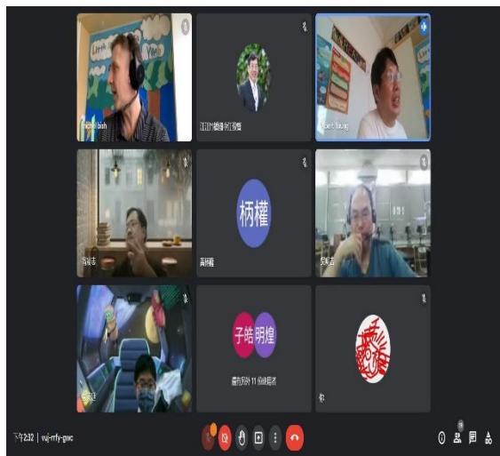
相片說明：線上研習