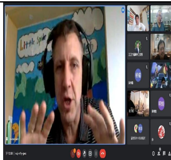
相片說明：線上研習