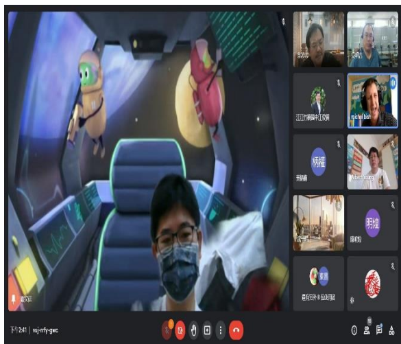
相片說明：線上研習