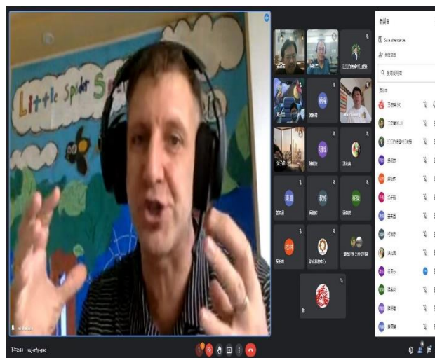
相片說明：線上研習