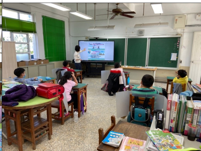
說明：教師介紹性別刻板印象