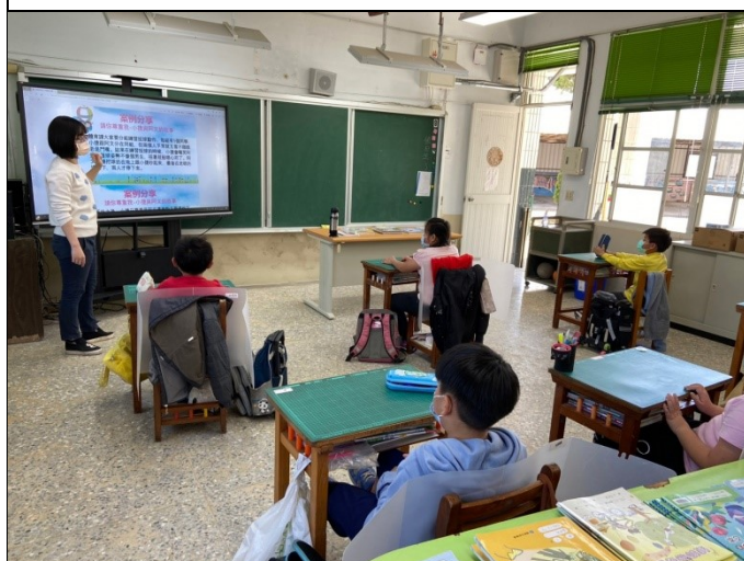
說明：教師以小傑和阿文的故事進行案例分享