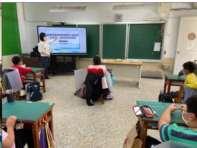
說明：老師以簡報解說「性別尊重」