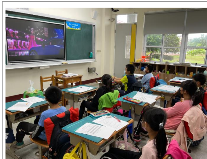
說明：學生專心觀看性平相關影片