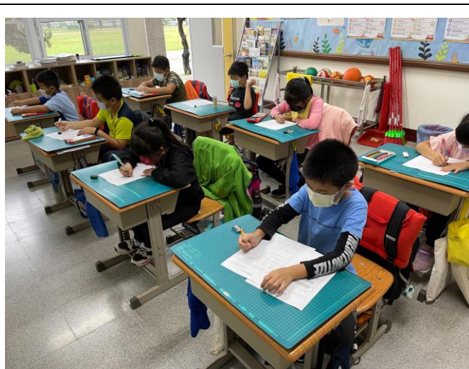
說明：學生書寫學習單