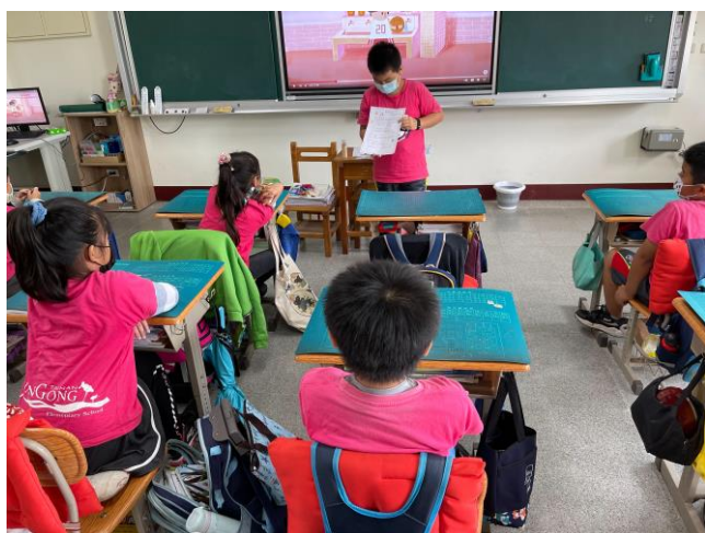
說明：學生上台分享學習單內容