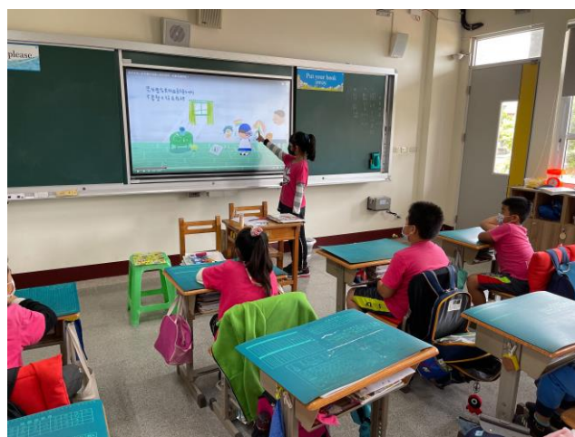
說明：上台分享影片呈現有待討論之片段