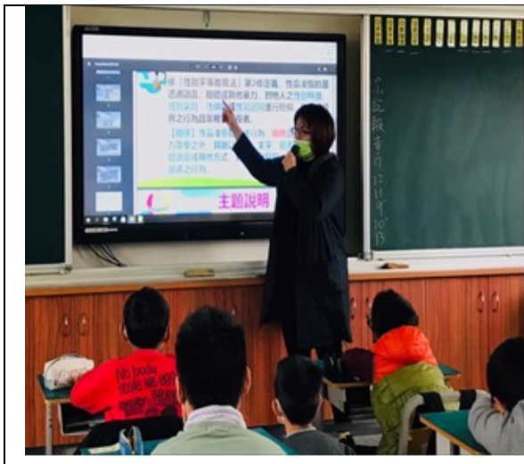
說明：「性別平等教育法」法條說明