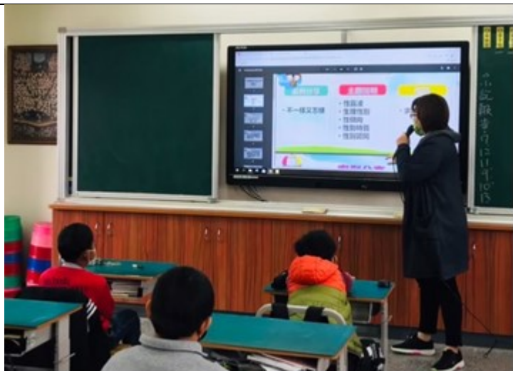
說明：性別詞彙澄清