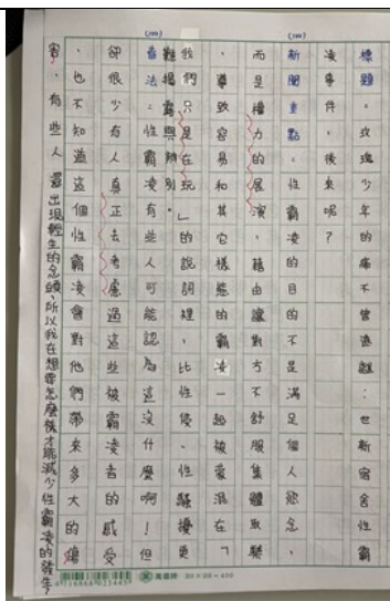
說明：學生課後作業