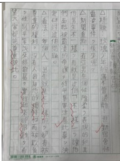
說明：學生課後作業