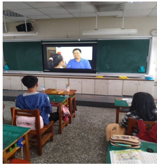
說明：學生觀看「那一年我們一起追夢~性別與職業」影片情形