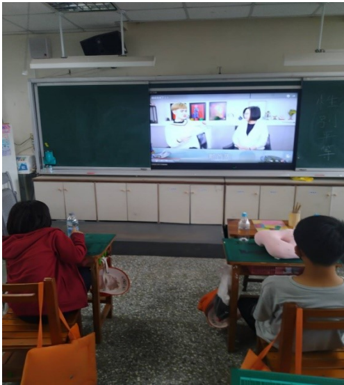
說明：學生觀看「鍾明軒-總統我來了」影片情形