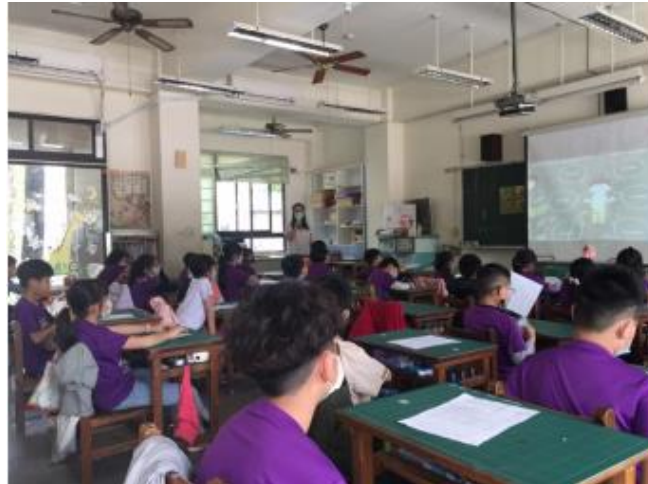
說明：師生共同閱讀繪本