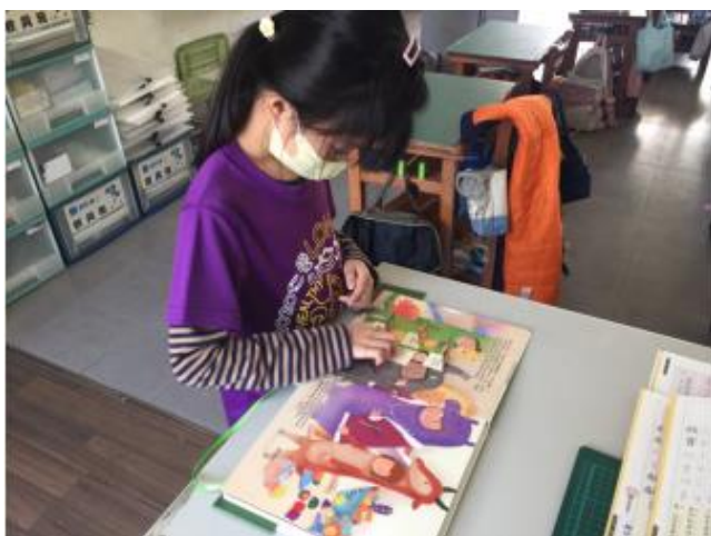
說明：學生課後自行閱讀繪本