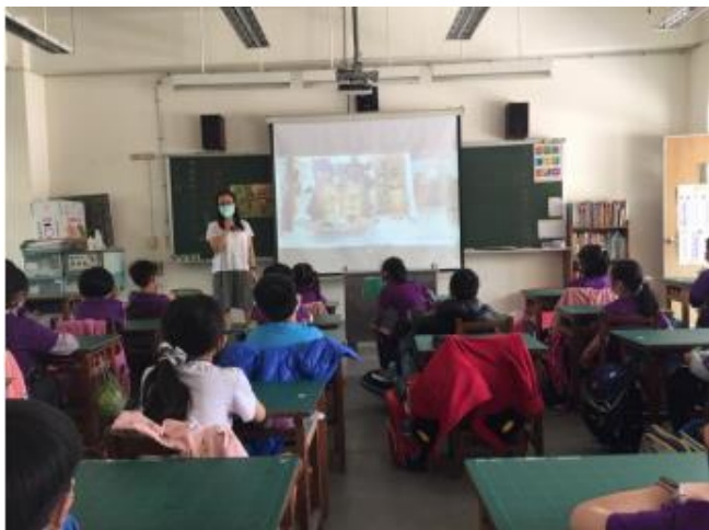
說明：師生共同閱讀繪本