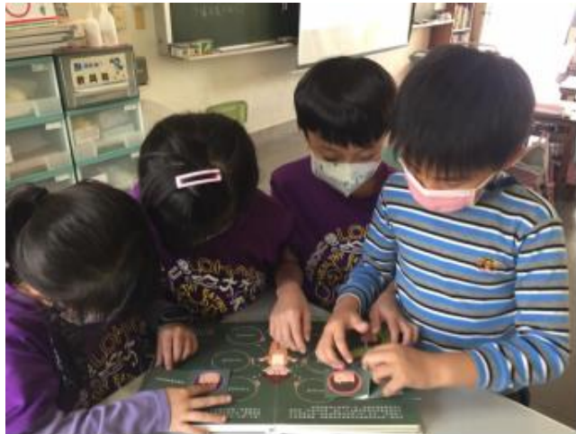
說明：學生課後自行閱讀繪本