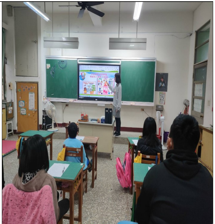
說明：如何自我保護