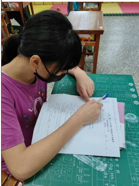
說明：綜合活動學生練習