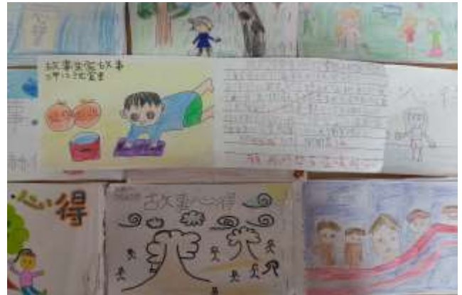
說明：聽故事寫心得