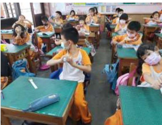
說明：認識五花八門的家事