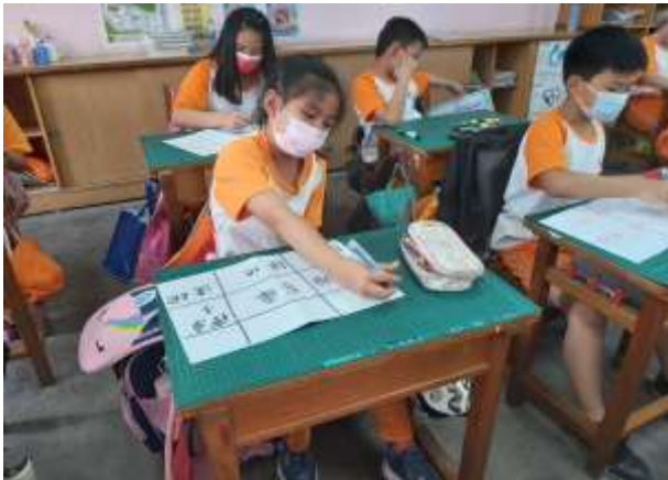
說明：九宮格板寫出自己或家人做過的家事