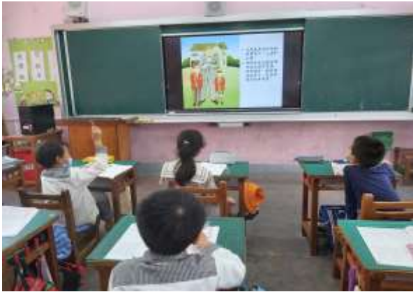
說明：播放朱家故事