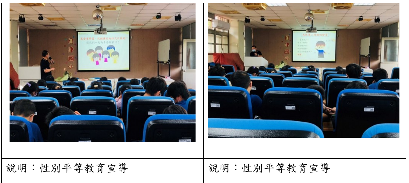
臺南市國民教育輔導團性別平等教育議題創意課程及教案實施成果照片