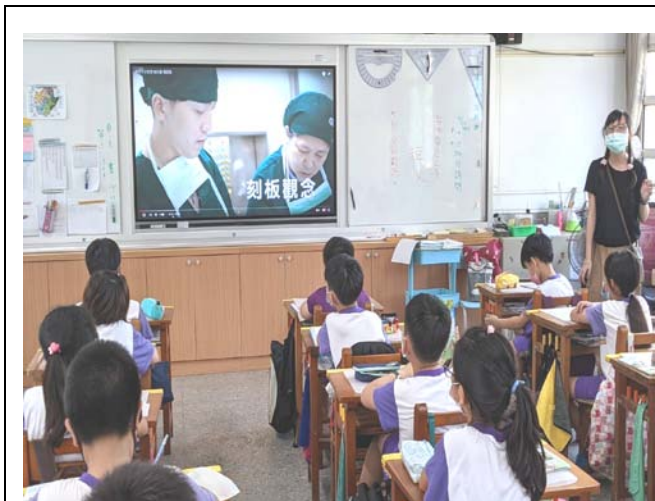
說明：教師讓學生觀賞職業不分性別影片，讓學生瞭解性別不是職業選擇的阻力。