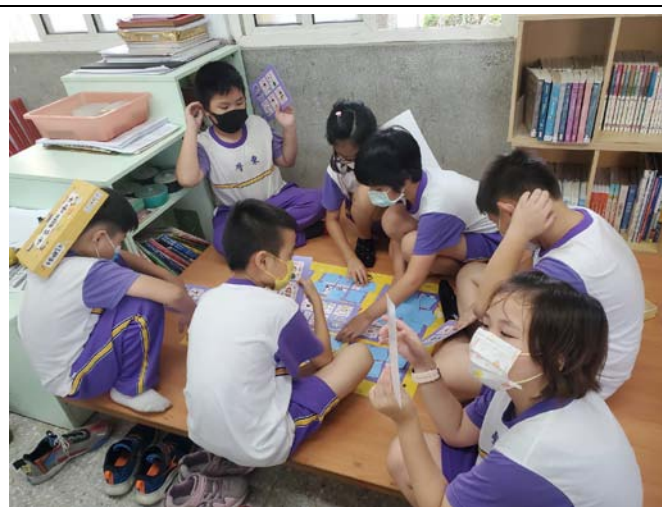
說明：教師讓學生玩未來職多少桌遊，並引導學生觀察牌卡與對應板上職業與性別的關係