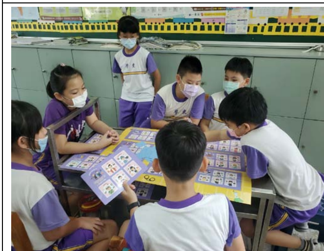
說明：教師讓學生玩未來職多少桌遊，並引導學生觀察牌卡與對應板上職業與性別的關係