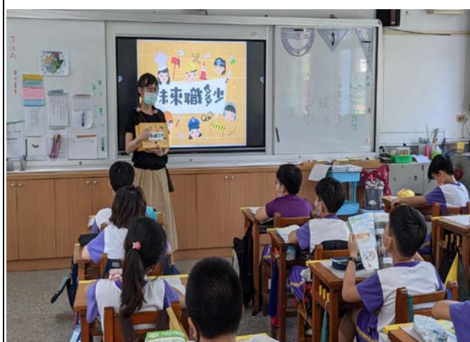
說明：教師向學生介紹未來職多少桌遊玩法，讓學生自行觀察牌卡中職業與性別的關係。