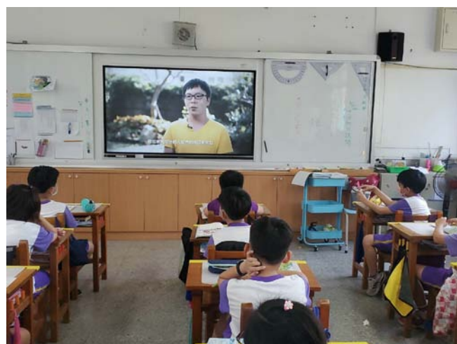
說明：教師讓學生觀賞職業不分性別影片，讓學生瞭解性別不是職業選擇的阻力。