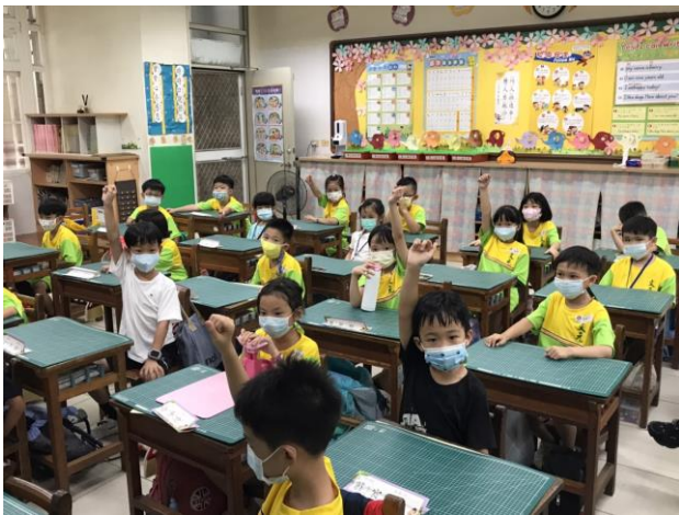
說明：學生舉手回答老師的提問