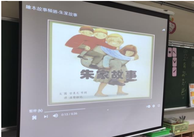
說明：朱家故事繪本影片欣賞