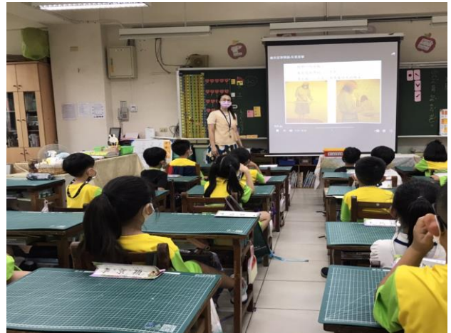
說明：老師說明故事內容