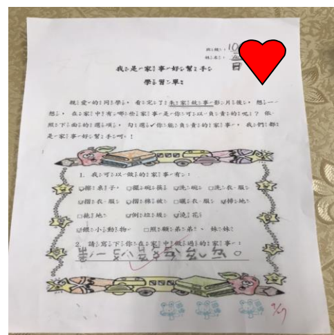
說明：課堂上完成的學習單