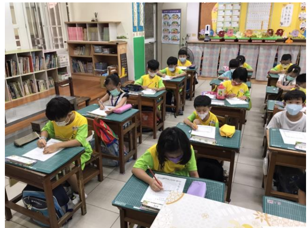
說明：進行學習單的書寫