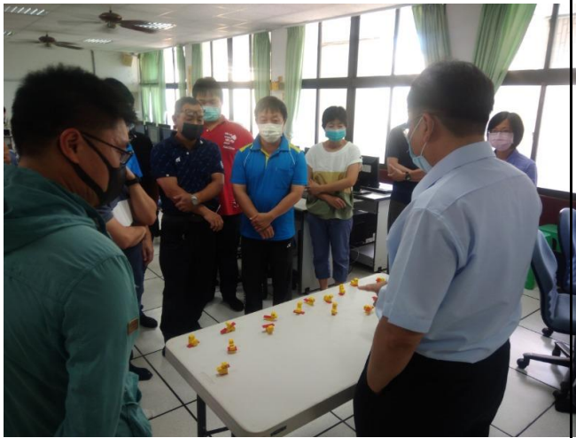
相片說明：課程內容1