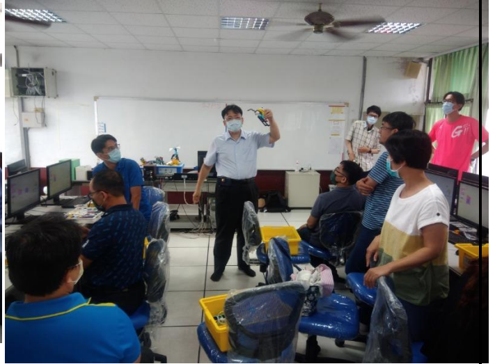
相片說明：課程內容2