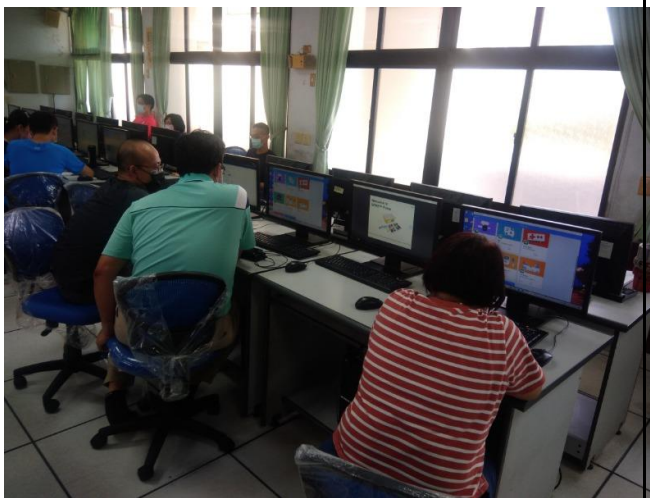
相片說明：課程內容3