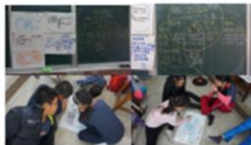
郁雅老師分享教學技巧及學生學習歷程