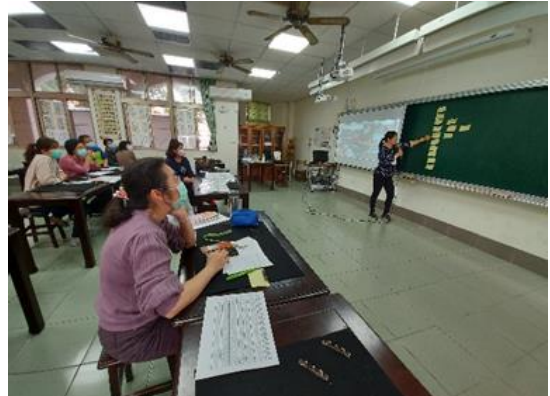
從社會領綱學習表現中圈出動詞發現其概念。