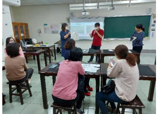
學員練習提出「遊戲」之關鍵字詞，再組成有意義的句子，歸納出其概念、通則。