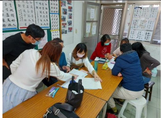
學員依不同年級的課本練習教材分析與建立通則