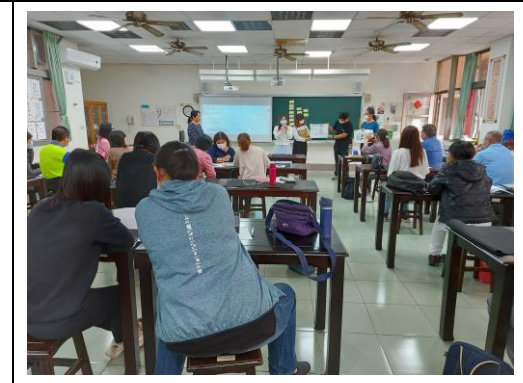
學員分組發表其討論結果