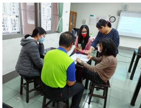
學員依不同年級的課本練習教材分析與建立通則