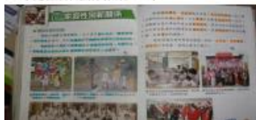
5-2家庭性別新關係(翰林六上)