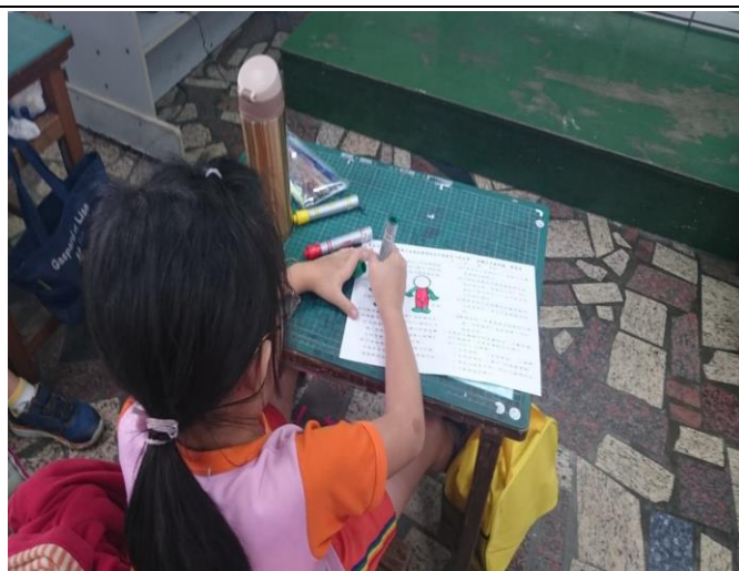
說明：學生經過老師的講解，完成學習單