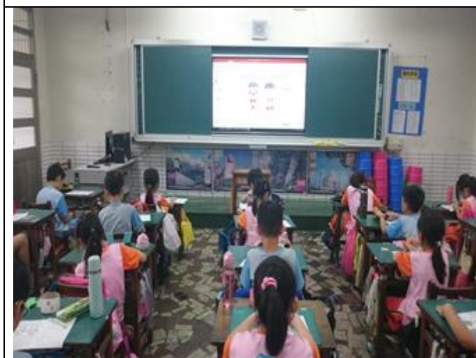
說明：透過 PPT，學生更加了解身體界線，能更清楚的填寫學習單