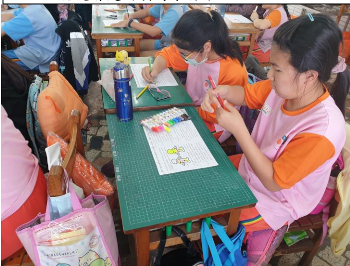
說明：依照自己的想法完成學習單