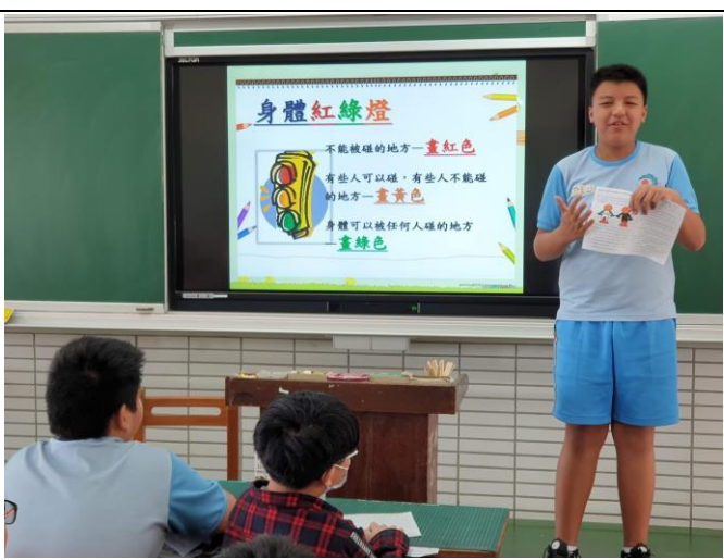
說明：學生分享學習單