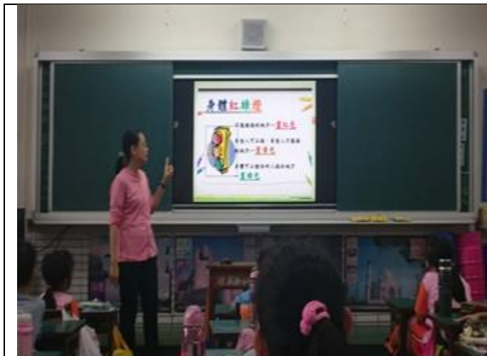
說明：利用 PPT 介紹主題