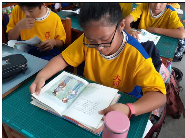
說明：學生仔細閱讀文本