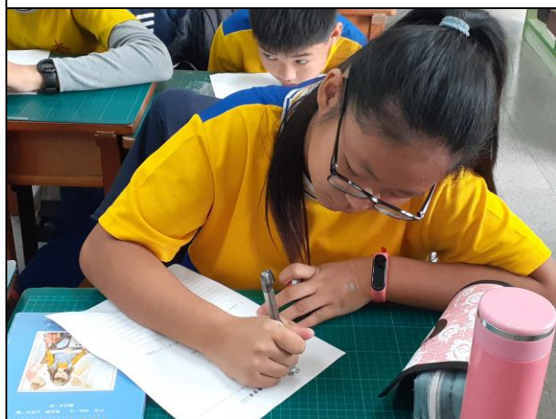
說明：學生寫下看法