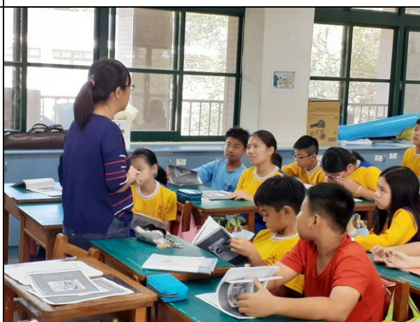
說明：針對學生的看法提出反駁