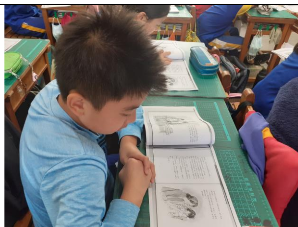
說明：針對文本不明瞭之處標示再閱讀