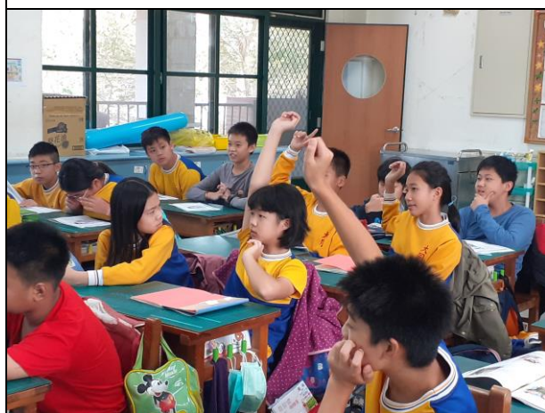
說明：針對兩難問題做出選擇