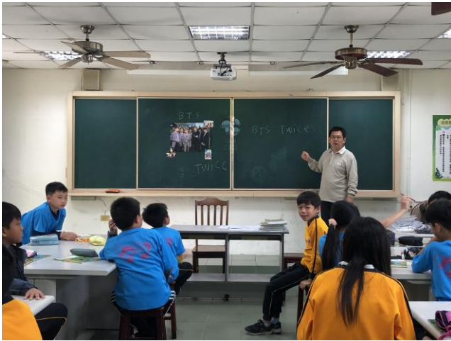
說明：票選偶像活動