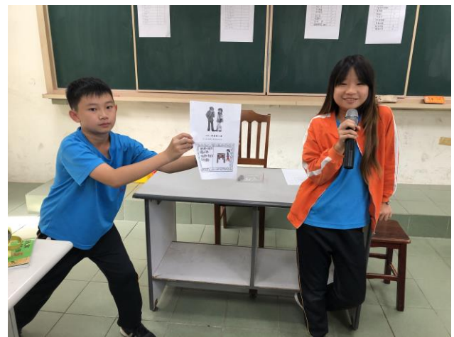
說明：我是萬人迷發表