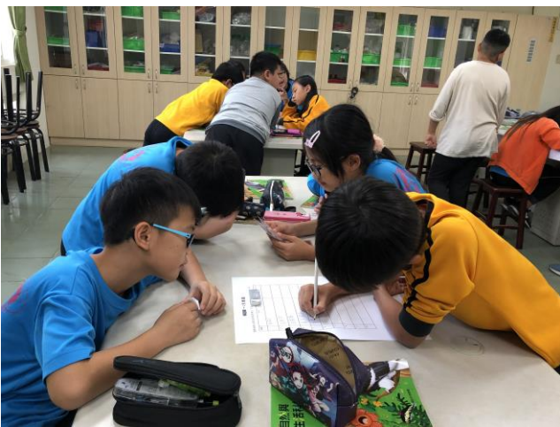
說明：討論受歡迎的人具有那些特質