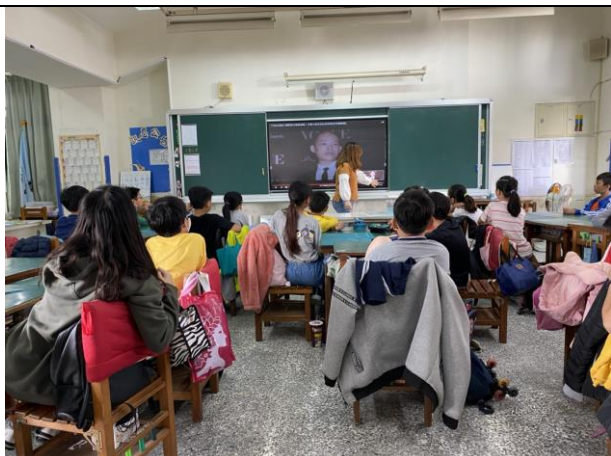
說明：觀賞吳季剛介紹影片。