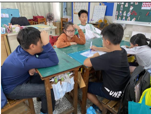
說明：進行 ORID 討論法。