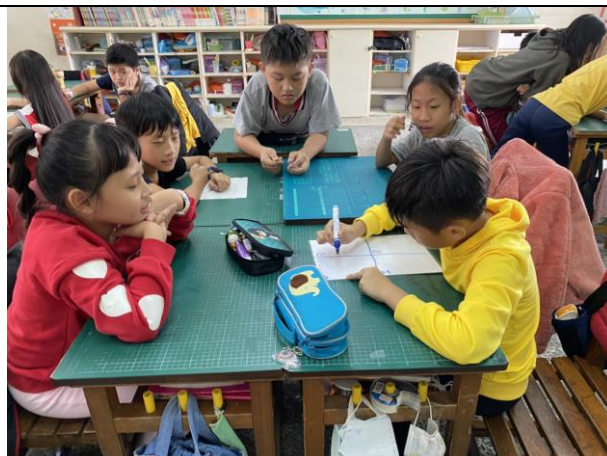
說明：影片觀後分組討論。