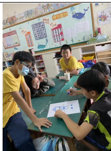
說明：分組繪製職場新風景。