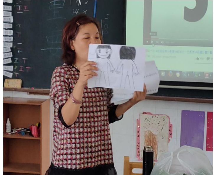
說明：老師說明如何寫學習單