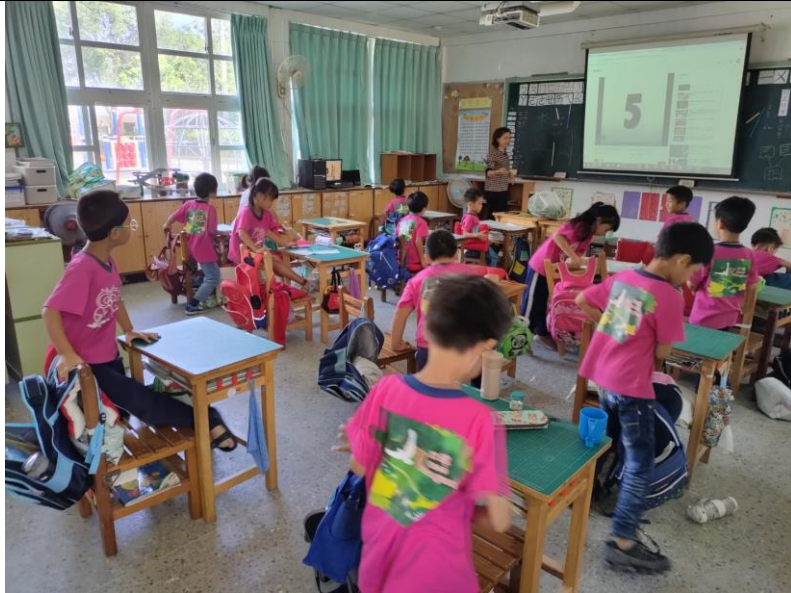
說明：學生在遊戲中，模擬情境如回答對方