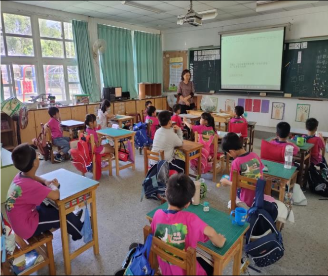
說明：老師與學生互相討論問題