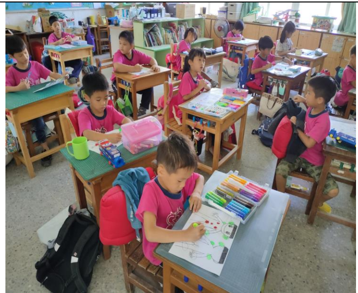
說明：學生們認真寫著學習單