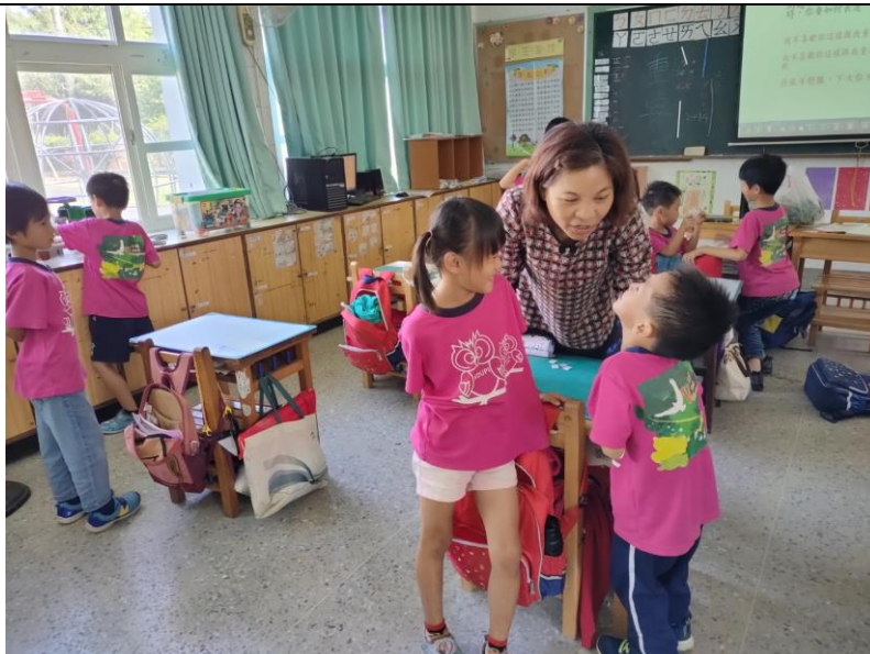
說明：老師在旁傾聽兩兩學生互相練習如何回答問題