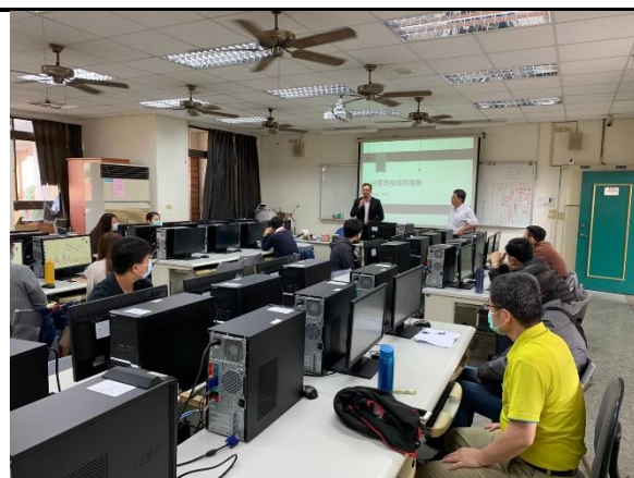
相片說明：與會老師認真聽講