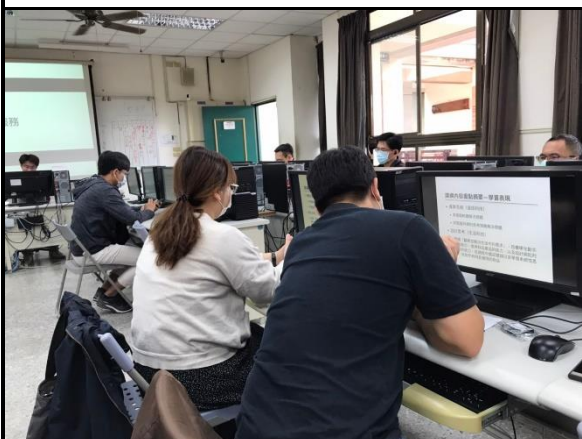
相片說明：與會老師認真聽講