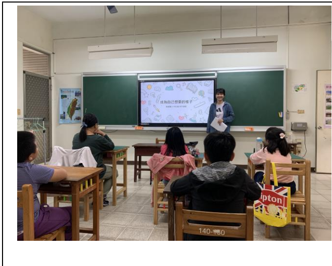
說明：討論未來想成為的樣子