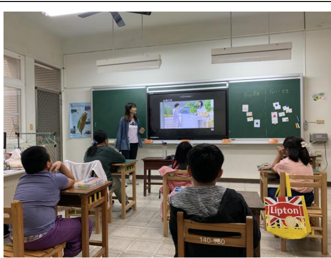
說明：檢視電視廣告中的性別意涵