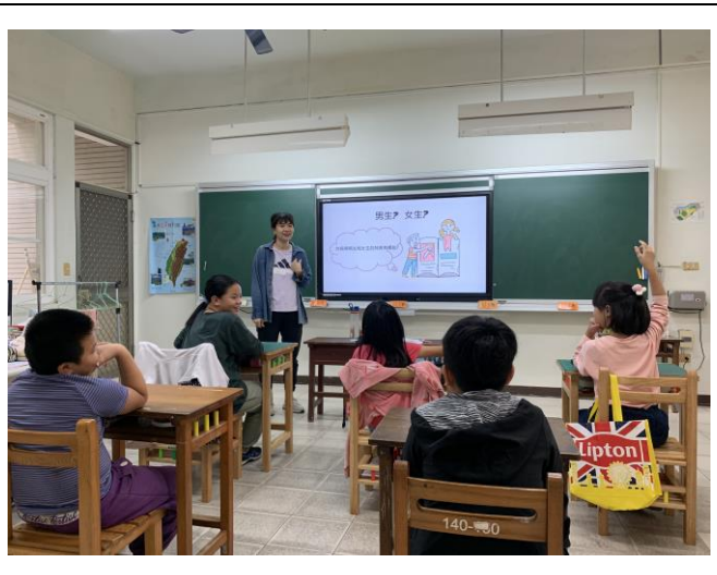
說明：說說看男女生的特質有哪些