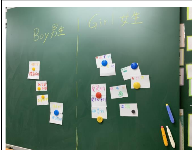
說明：將男生女生寫的分開貼並觀賞討論