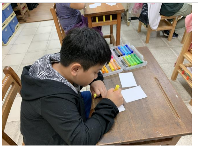
說明：學生填寫三個自己的特質