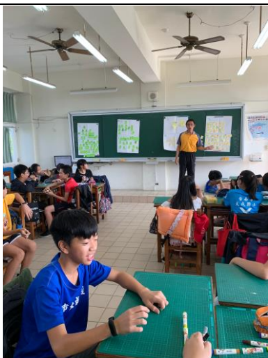
說明：針對各組發表老師上課說明