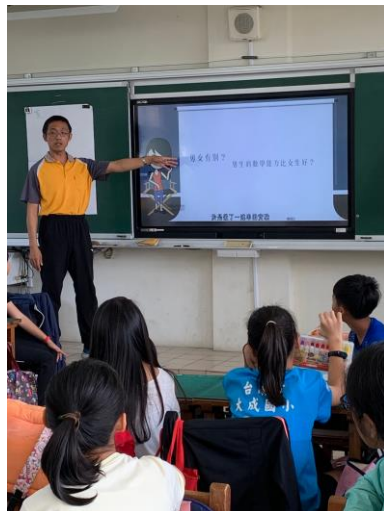
說明：男女有別，男生的數學比較好嗎？