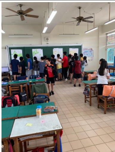
說明：對於家裡是否有性別上不同的對待。