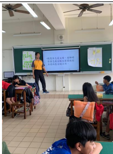
說明：總結。勿成為下一位性別不平等對待的製造者。