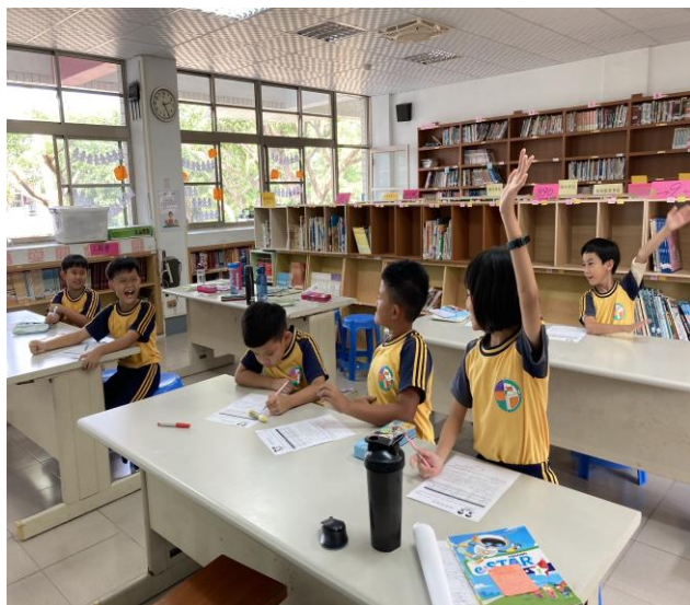
說明：請學生就其學習單兩次選擇的差異，發表看法。