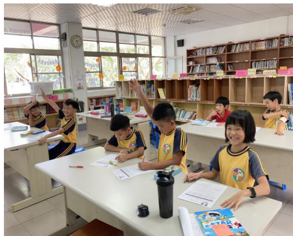
說明：播放性平影片前的想法分享