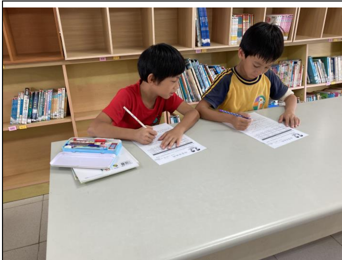
說明：學生以黑筆選出學習單中男女生的特質